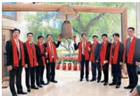
▲南通三建在北京新三板掛牌上市

比亞迪在蘭開斯特的工廠目前佔地8000平方米，僱用當地員工300多名，年產電動巴士300輛，主要用於城市公共交通。根據擴建計劃，未來三年內，比亞迪將分階段將工廠面積擴大到3.7萬平方米，產能擴大到每年1000輛，產品範圍從電動巴士拓展到電動卡車和專用車輛，當地員工人數增加到1000名以上。