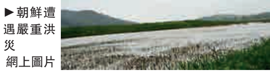
►朝鮮遭遇嚴重洪災