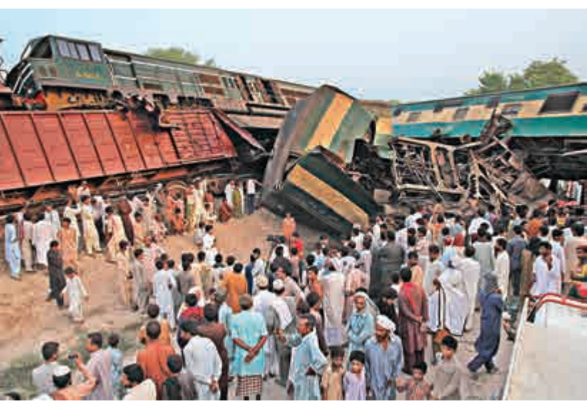
▲巴基斯坦兩火車相撞，其中一車脫軌