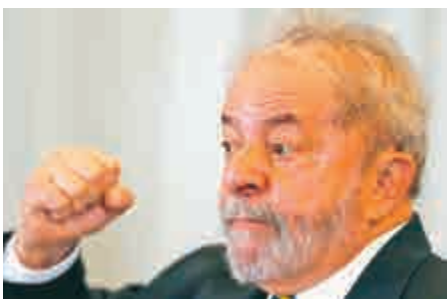
▲巴西前總統盧拉

檢察院指出，奧亞斯建築公司為裝修與購置傢具花費了約37萬美元，加上為盧拉存放個人物品免費提供的倉庫，總支出112萬美元。檢方認為，該款項應被視為