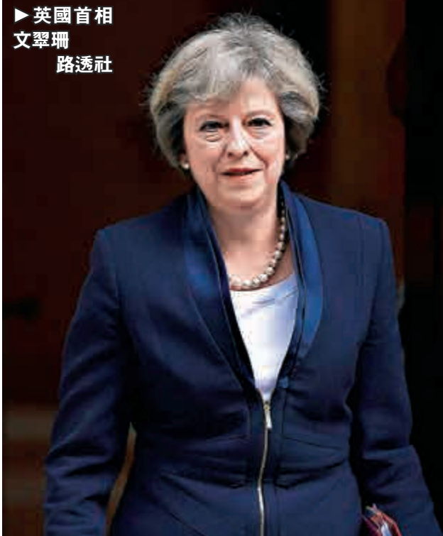
►英國首相文翠珊