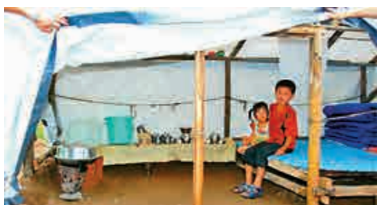
▲朝鮮洪災致數百人失蹤 英國廣播公司