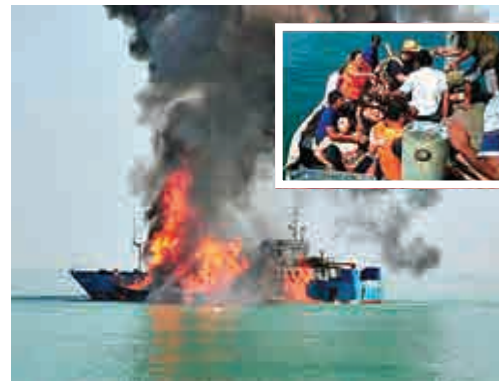
▲峇里島觀光船發生爆炸

印尼島嶼眾多，船運是該國主要交通方式之一，但由於海況惡劣和缺乏安全規範等原因，海上安全事故時有發生。