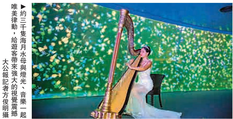
▲約三千隻海月水母與燈光、音樂一起唯美律動，給遊客帶來強大的視覺震撼

全新水母缸展窗長12米，深4米，寬3.5米。水母本身透明無色，但水母缸透過使用DMX燈光控制系統，讓燈光、音樂與水母一起律動，構成一個奇妙的海底世界。(記者 方俊明)