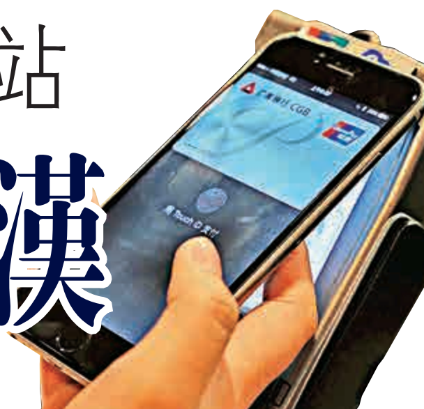
▲銀聯「雲閃付」為用戶打造獨一無二的支付「登機牌」 ▲裝了「神器」的手機，手機菜單內會顯示被限制的手機功能，一般禁止的包括藍牙、無線網絡連接、定位服務等功能

正在武漢舉行的第三屆中國國家網絡安全博覽會上，中國一批維護網絡安全的「新式武器」掀開面紗，當中包括有「刷臉」支付系統、偽基站實時發現系統等等，協助維護網絡安全，保障社會大眾利益。