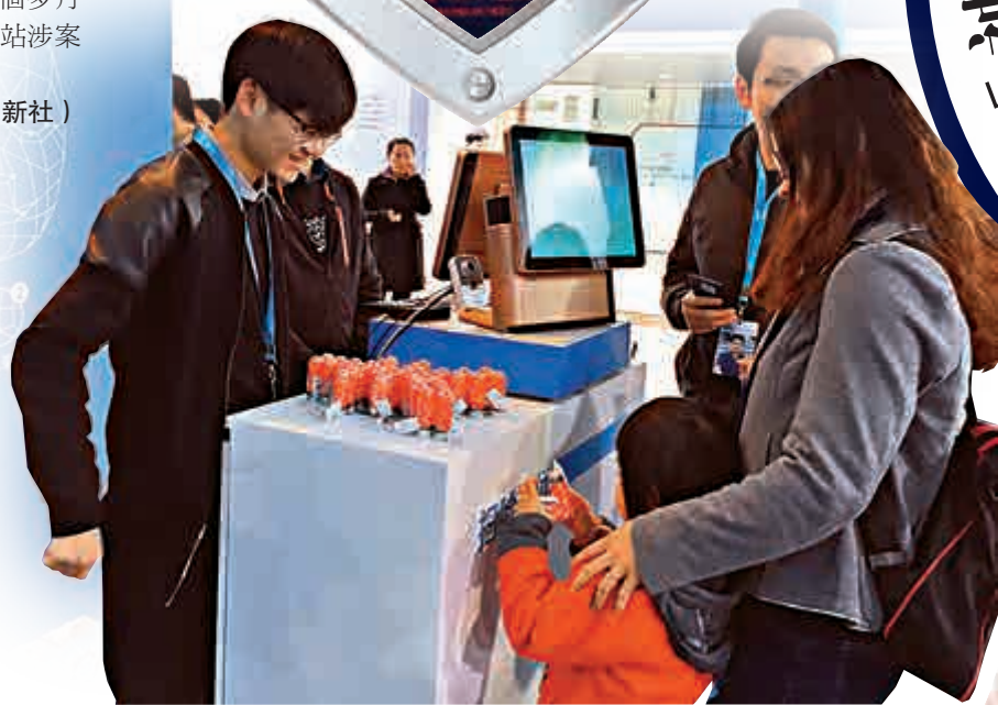
▲「神器」助士兵上網不泄密