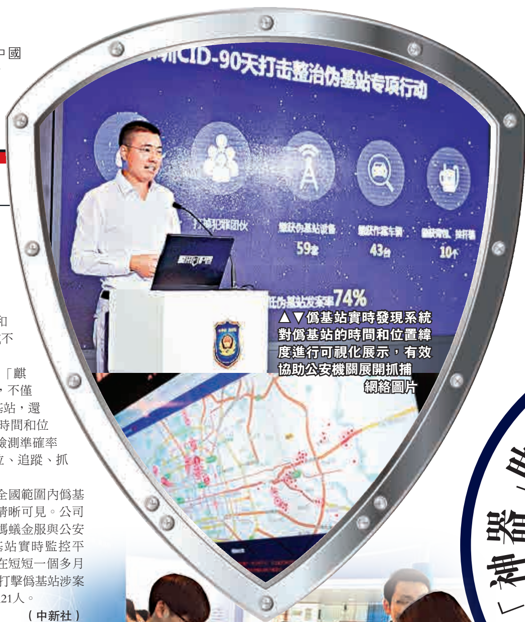
▲偽基站實時發現系統對偽基站的時間和位置緯度進行可視化展示，有效協助公安機關展開抓捕