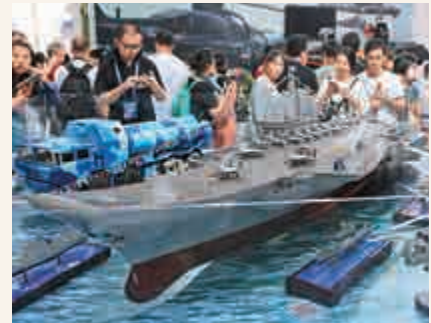
▲觀眾參觀航空母艦編隊模型

展出的模擬艙按照中秋發射的天宮二號同等比例打造。走進模擬艙，觀眾能夠近距離觀看艙內航天服，觸摸模擬版月球儀，並可以在模擬航天器裏一窺宇宙真容。相比往年，今年的北京科學嘉年華可以說是一場高度融合前沿科技的「航天科普秀」。為使展覽更為逼真，組織方專門配套設立了天宮二號7D影院，通過VR互動系統、多媒體系統、空間站模擬設備與天宮二號仿真模型相結合，觀眾置身其中如身臨其境，可體驗到飛船發射、升空、太空遨遊、對接的全過程。