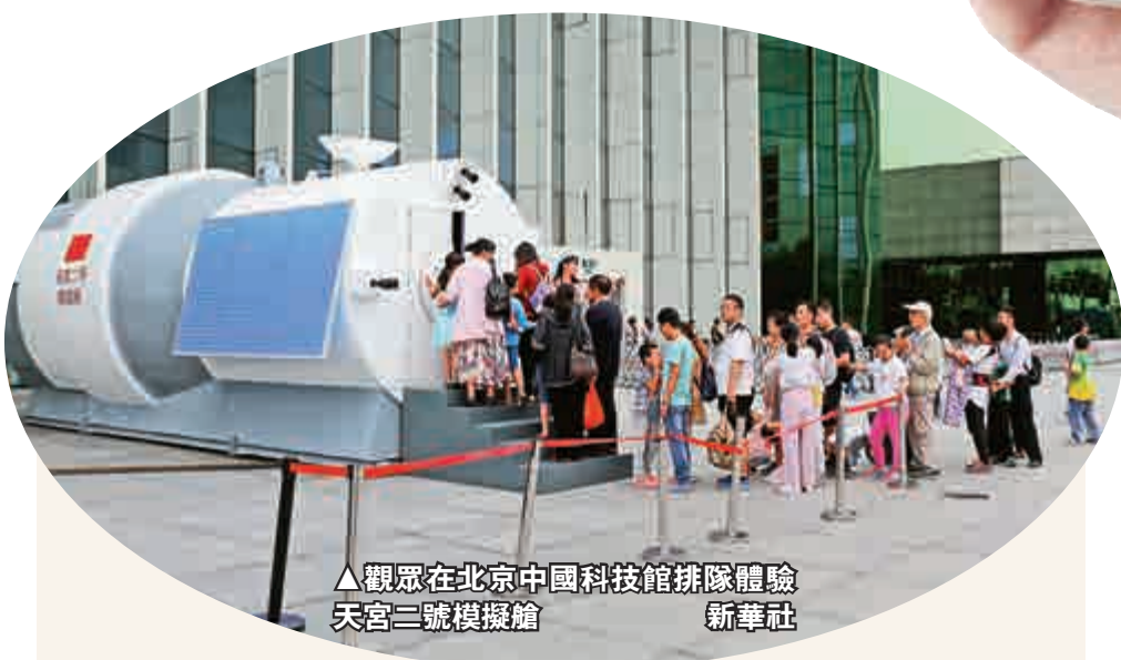
▲觀眾在北京中國科技館排隊體驗天宮二號模擬艙