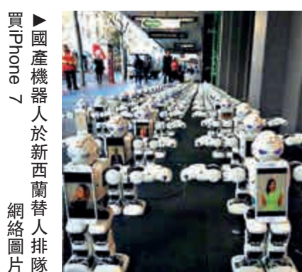
▲國產機器人於新西蘭替人排隊買iPhone 7

近日，蘋果iPhone 7手機正式發售，世界多地的零售店門前大排長龍。同樣是排隊買iPhone 7，新西蘭的一家