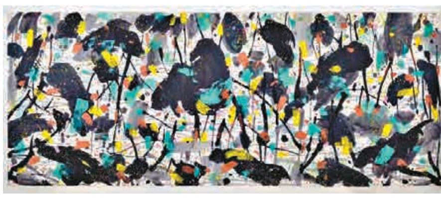
吳冠中的巨幅水墨畫《荷塘》（一九九七年），估價待詢。

【大公報訊】記者湯艾加報道：保利香港2016秋季拍賣會將於十月一日至四日在港舉行，日前在金鐘舉行了一場媒體導賞，展出逾四十件是次秋拍的重點拍品，涵蓋中國及亞洲現當代藝術、中國當代水墨、中國近現代書畫、中國古代書畫、中國古董珍玩等。