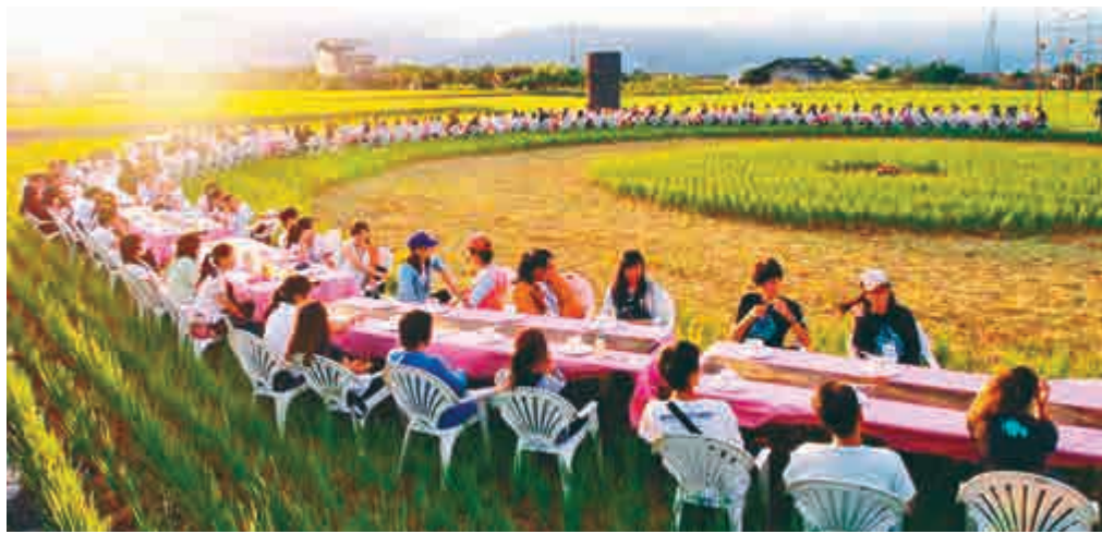
▲將會與薄扶林村合作的「稻田裏的餐桌計劃」(過往活動圖片)

受台灣各界歡迎的「稻田裏的餐桌計劃」，是一個以村落作為舞台的「行動劇」方式，透過創意餐會，翻轉台灣傳統價值。該「計劃