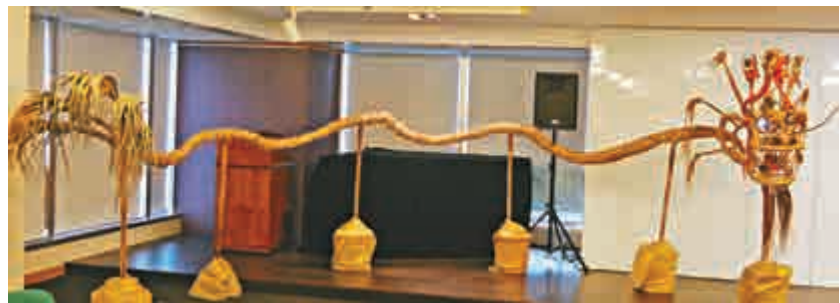
▲「台灣月」記者會現場富有香港民俗特色的中秋火龍

【大公報訊】記者湯艾加、劉裕欣報道：第十一屆「台灣月」新聞發布會昨日於灣仔光華新聞文化中心舉行。今年的「台灣月」以「Taiwan Redesign——從我到我們」為活動主題，旨在與香港分享社會設計上的創意與串聯能量，表達跨界和開放的台灣新文化面貌，透過系列與香港攜手合作的節目，深度發展與香港文化團體的交流。