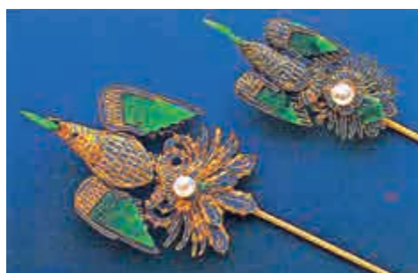
上品頗奇貨。后妃權貴亦喜以金作鳳釵頭，以玳瑁為腳；此乃源於秦始皇時的金鳳釵製法(可參見五代馬綽《中華古今註·釵子》)。清代后妃亦愛招絲、縷絲等精細工藝，並配嵌珍珠。附圖一雙珍品，正好集上述工藝之大成。

清代婦女髮飾，特別喜歡「點翠」，主要受當時皇宮后妃愛佩戴有關；事實上，翠鳥羽毛(近綠松石色和天藍色)十分嬌美奪目。晚清時，慈禧鍾情緬甸翡翠(翠玉)，老坑騰崇拜衍變而來；以雌性為鳳，雌性