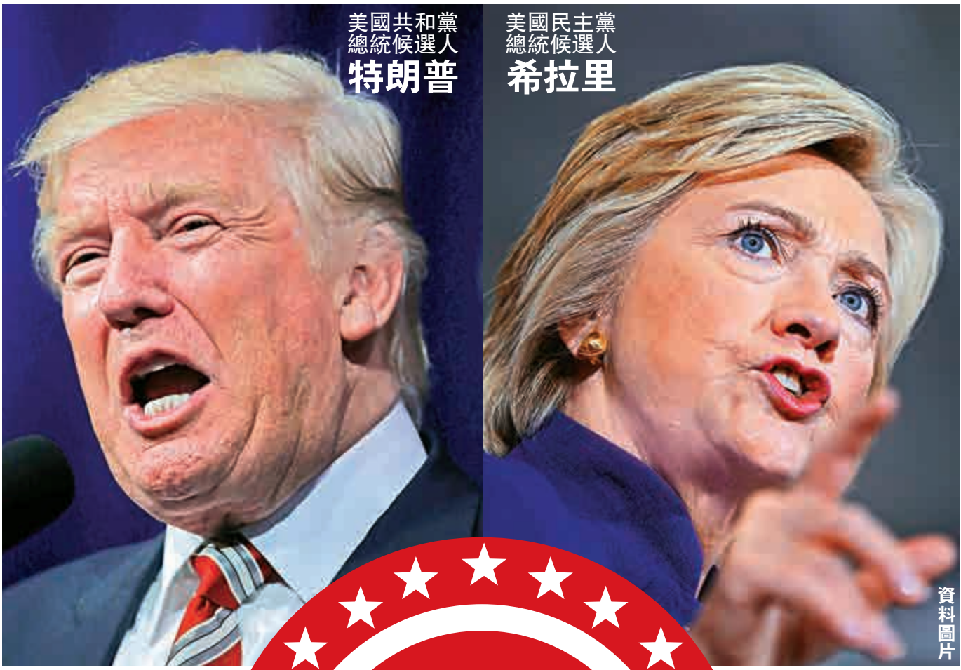
美國共和黨總統候選人 特朗普