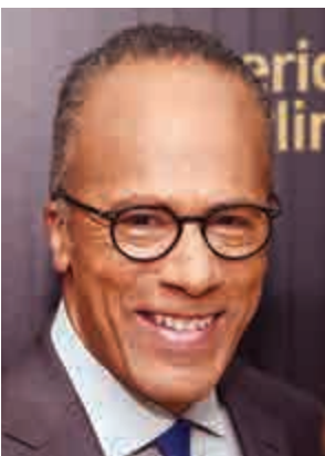
▲將擔任美總統大選首場電視辯論主持人的霍爾特

面對要求首場總統大選辯論的主持者表現得更為激進的呼聲，特朗普一方面宣稱勞爾「很專業」和「奇妙」，但另一方面也直言霍爾特「會承受很多壓力」。