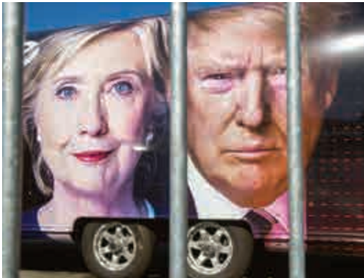
▲一部CNN的車輛上的兩位候選人的海報