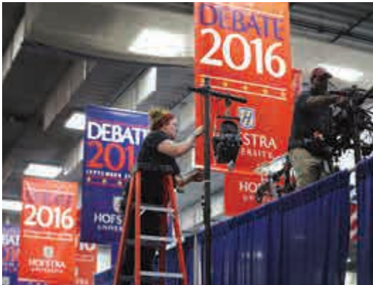
▲工作人員24日進行設備布置工作