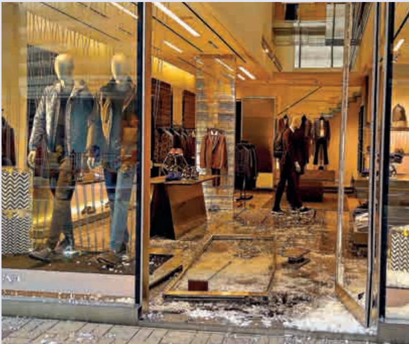
▲時裝店的大門及櫥窗被撞毀，一地玻璃碎片

據悉，三間被撞毀的店舖分屬不同集團，遭人破壞前未有收過恐嚇勒索報告，而三間店舖是由不同業主持有，就匪徒連環撞閘的原因，警方刻正追捕涉案匪徒以查明他們的動機。