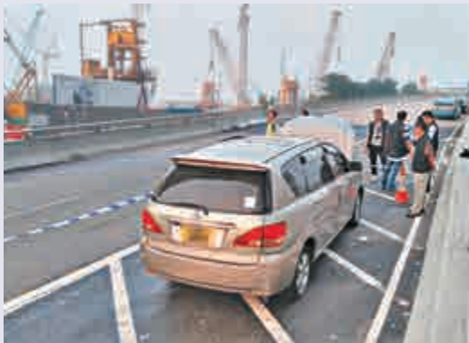
▲涉事七人車車廂內部遭放火焚毀，毀滅證據