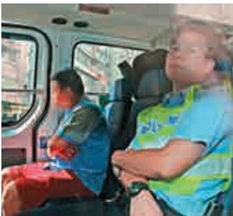
▲涉事司機被拘捕帶署