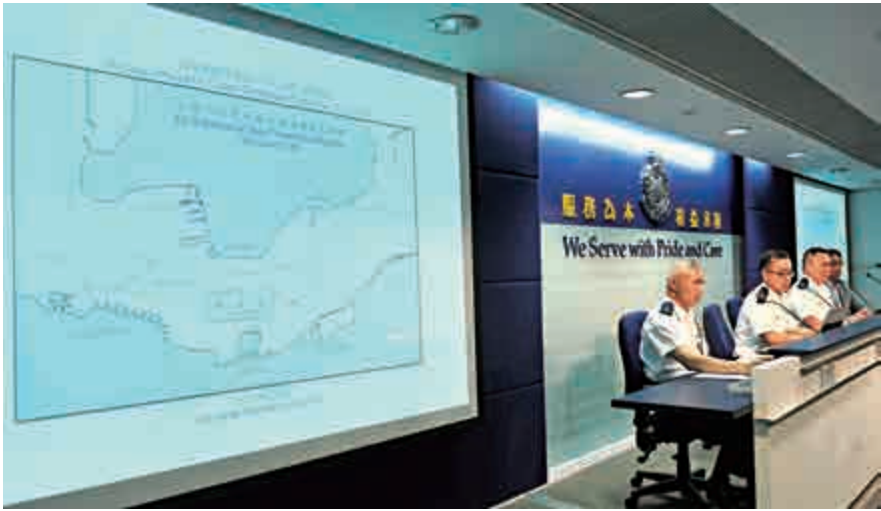
▲警方公布國慶煙花的封路安排