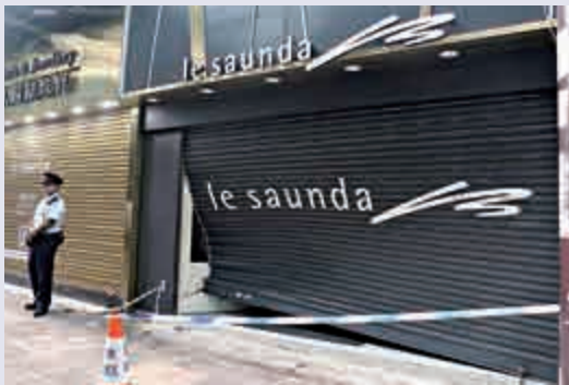
▶鞋店的捲閘被撞至捲曲