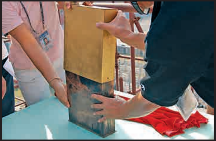
▲寶匣封裝，準備合龍

有鎮物。這些鎮物一般包括「五金」、「五穀」、「五藥」、「藥味」等物品。五金多為金、銀、銅、鐵、錫；五穀多用稻、麥、粟、黍、豆、黃柏等。鎮物還可包括珠寶、彩石、銅錢（多為二十四枚，上鑄有「天下太平」四漢字，也有滿漢文合鑄的），佛經，施工記錄等。