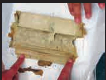
▲寶匣內主要鎮物：經書