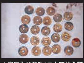
▲寶匣內的鎮物：二十四枚金幣