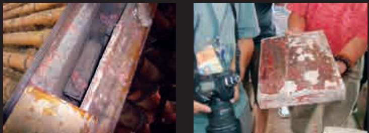
▲慈寧宮建築屋頂的寶匣