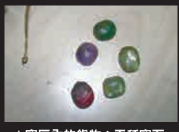
▲寶匣內的鎮物：五種寶石