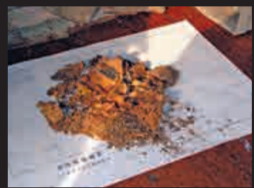
▲寶匣內主要鎮物：中藥