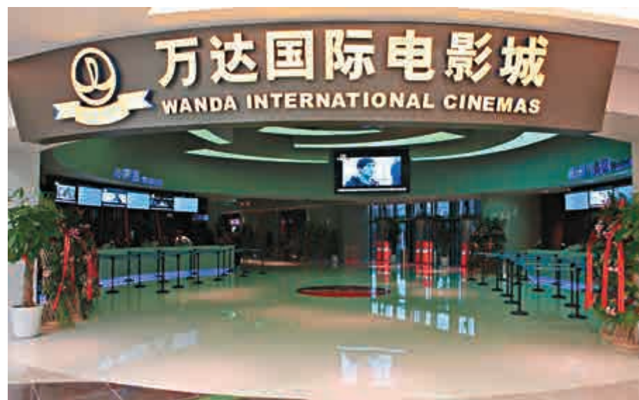
▲萬達集團逐漸向地產以外的產業和領域轉型

根據該協議，萬達集團將利用其票務平台和娛樂場所來向中國電影觀眾推廣索尼的電影。萬達集團還可能通過其在中國的超過2000塊電影屏幕播放索尼的電影。