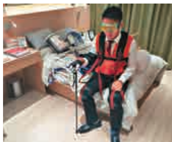
▲參觀者可以試穿「體驗衣」感受患病長者生活

由「長屋設計」經營，位於長沙灣的長者家居設計及照料服務體驗館，獲一個傢俬商場撥出800平方呎空間，三年租約，涉及市值租金約100萬元，但可獲免租。其中面積530平方呎的示範單位功能多多，睡房設有固定式吊機，協助行動不便的長者上床，亦安裝了活動式衣架，需要坐輪椅的長者將衣架拉低就可拿到衣服。長者最常發生家居意外的廁所，則採用防滑磚和扶手設計，避免長者因地面濕滑而跌倒。