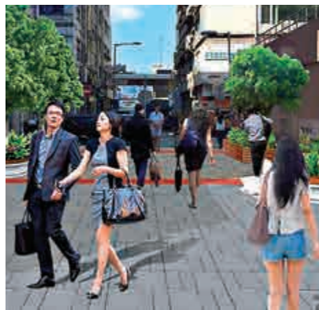
▲觀塘商貿區後巷美化後模擬圖

【大公報訊】記者曾敏捷報導：政府就觀塘商貿區行人環境改善計劃展開第三階段公眾諮詢，起動九龍東辦事處總結上階段諮詢，提出一系列短中長期改善方案，包括延伸港鐵牛頭角站隧道至海濱道、擴大後巷美化計劃等。多項擴闊行人路、改善行人過路設施等短期措施，預料將於2018年內陸續竣工。