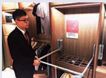
▲活動式衣架可方便坐輪椅的長者