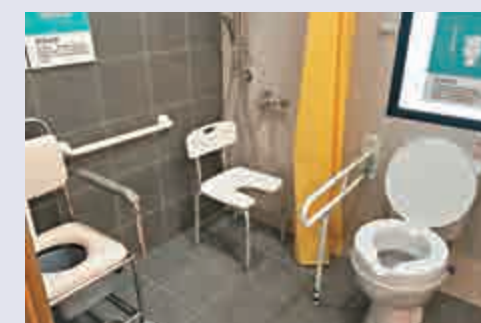
▲浴室使用防滑磚和設有扶手，以防長者跌倒