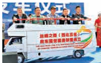
▲西北五省房車露營行業代表共同推動啓動桿