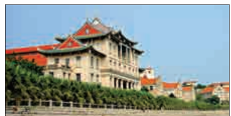
▲廈門大學舊址 ▼天安門觀禮台