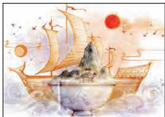
▲漫畫家筆下的南海神廟