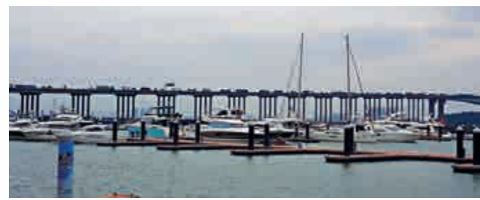
▲南沙首推大衆化遊艇消費項目

在29日開幕的2016南沙灣遊艇歡樂嘉年華，首次推出大衆化的水上休閒項目「188帆船體驗」及「288釣魚體驗」。這兩個平價項目使過去只屬於高階階層消費的遊艇揭開神秘面紗，讓普通市民有機會享受大海和風帆的魅力，感受海釣的樂趣，對推動遊艇產業發展有促進作用。