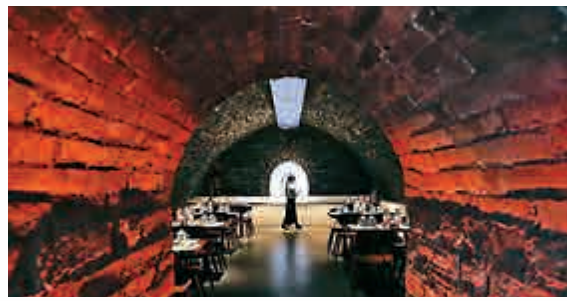
▲建於清乾隆年間的4座故宮冰窖開放為觀眾服務區