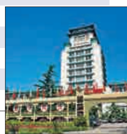
▲廣州市中山紀念堂