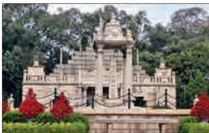
▲黃花崗七十二烈士墓園 ▲人民英雄紀念碑