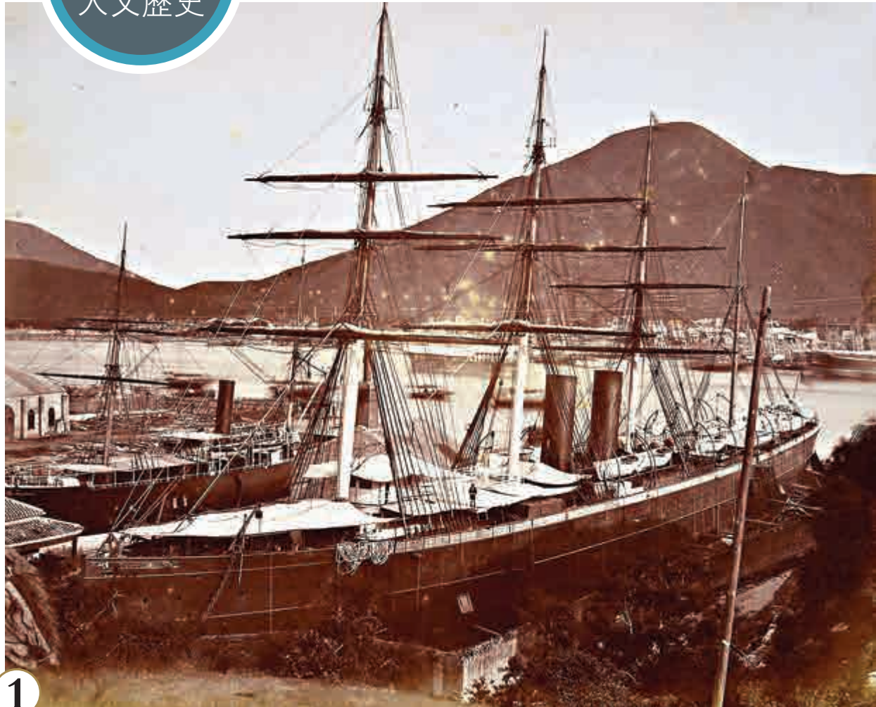
孫中山於一八九五年十二月六日已乘圖示的「北京城號」抵達夏威夷，而港英政府約三個月後才頒下首個驅逐令