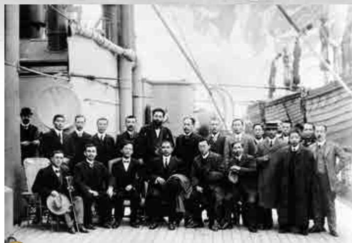
一九一二年十二月二十一日，孫中山乘英輪「地雲夏號」回國時途經香港，與革命友人在船上合照