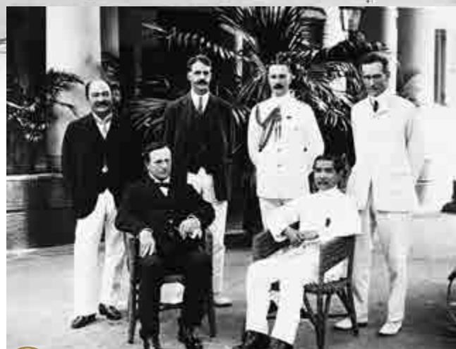
一九一二年五月二十日，孫中山（前右）訪港期間，在總督府與署理港督施勳（前左）進行非官方的私人會談