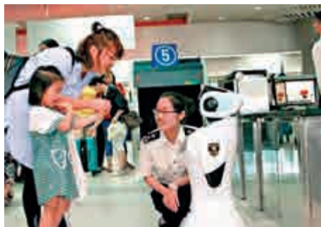
「小海」與旅客熱情互動

【大公報訊】據新華社報道：1日，以輔助旅檢查驗方式，首批10個萌萌智能機器人在廣東省珠海市的拱北、橫琴、中山的中山港等3個口岸旅檢現場同步「上崗」。