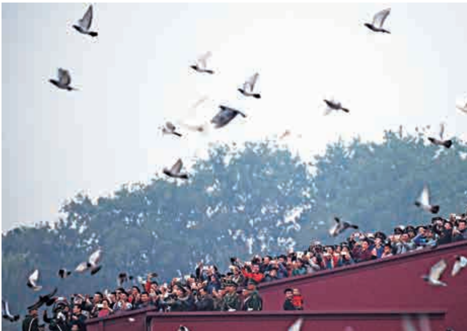
超過10萬人觀看天安門廣場國慶升旗儀式，儀式後和平鴿展翅飛起

【大公報訊】記者張聰北京報道：昨日是中華人民共和國成立67周年紀念日，天安門廣場舉行國慶升旗儀式。據天安門管委會統計，約10萬人進入廣場觀看升旗儀式，人數超過去年的7萬人。記者發現，與往年不同，升旗儀式結束後，部分遊客自發與環衛人員一起清理廣場上的垃圾，需時不到20分鐘便完成清理工作。