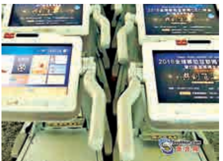
白雲機場新一代智慧手推車國慶假期登場

到了登機時間，系統會彈出窗口提醒；使用完畢沒退出系統，智慧手推車會立刻返回主頁保護旅客個人信息。點選「空港頻道」，候機樓洗手間及餐飲及商店位置一目了然，並準確引領使用者到達任何目標區域。倘選定登機口方向卻走錯路線，智慧手推車會彈出窗口「糾錯」。