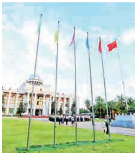
海南省三沙市1日早上同時在西沙群島9個島礁舉行國慶升旗儀式，圖為三沙市政府大樓前升旗儀式

另據南海網報道：三沙永興島4個總面積近9000平方米的蔬菜大棚種植蔬菜，可月產萬餘斤瓜菜，足以滿足永興島居民所需。水培大棚不用泥土種菜，種菜用水是永興島海水淡化水。