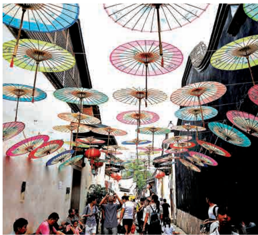
▲10月1日，福州「三寶」之一的五彩油紙傘觀麗「綻放」古街 中新社