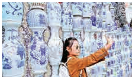
▲黃金周首日，天津「神奇建築」瓷房子迎客流高峰。圖為遊客自拍

爲此，日本JTB旅行社和松下公司近期聯合推出了2項針對赴日中國遊客的新型服務，使不懂日語的遊客也可輕鬆赴日自由行。（記者 孫琳）