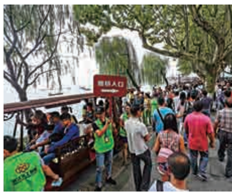
▲10月1日，杭州西湖景區人流如織

據悉，爲讓遊客能更便捷安排行程，杭州開通了3條景區換乘的接駁專線，並推出了一系列「智慧旅遊」措施。（記者 王莉）