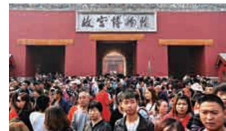
▲「十一」假期首日，北京故宮博物院門前人潮湧動