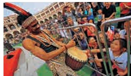
▲10月1日，第十三屆「中國天津五大道旅遊節」開幕