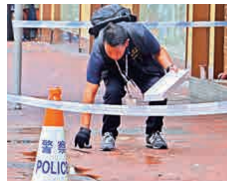
▲重案組探員檢走兇徒留下的牛肉刀