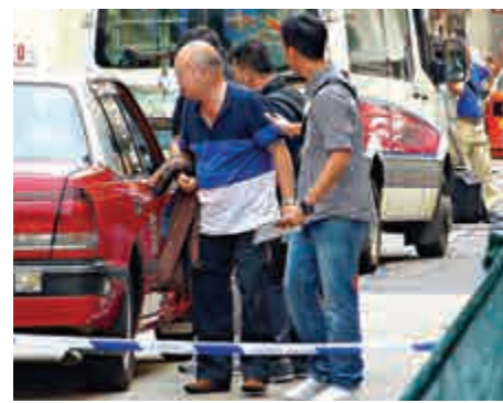
▲曾接載中槍疑犯的士司機（左）協助探員調查