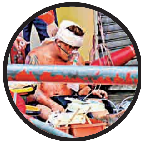
▲被同鄉斬傷的尼泊爾男子

昨天早上，開槍現場一段白加士街仍封鎖。警方先後檢獲兩把八至九吋長的牛肉刀。兩名開槍的衝鋒隊警員，向負責調查案件的重案組探員講述經過，他們右手亦要套上膠袋等候檢驗，探員再檢走兩警的配槍及槍袋裝備。至中午時分，警方派出約50名機動部隊警員，在現場「地毯式搜索」彈頭，最終在一間小食店外，尋獲一粒懷疑貫穿疑犯手臂的彈頭。昨天下午二時許，機動部隊收隊離去，現場始解封。