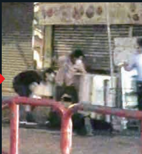
3. 刀手無視警告繼續施襲，警員開槍制止，槍口冒出火光

兩名衝鋒隊警員昨清晨在油麻地白加士街巡邏期間，目擊一名尼泊爾漢遭至少六名男子追斬，警員擊槍喝止無效，傷者倒地仍遭兩名同鄉掄刀追斬，千鈞一髮之際兩警鳴槍四響制止。其中一名兇徒身中三槍，他送院救治後情況危殆，另一名兇徒手部中槍後，乘的士逃走，但被迫至的衝鋒隊便衣女警攔車拘捕。西九龍總區重案組已接手調查開槍案，正深入調查傷人案動機，及追緝其他涉嫌傷人的兇徒。