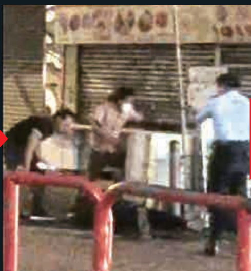
2. 警員衝上前擊槍喝止刀手行兇