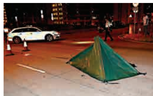
▲新清水灣道致命車禍現場

接獲有人報案，指上址有人昏迷馬路上。警方跟進是否與陳被撞倒有關。東九龍總區交通部特別調查隊正跟進案件，並呼籲任何人如目睹意外發生或有資料提供，請致電23057500與調查人員聯絡。