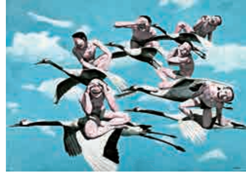
▲岳敏君的《天空》出人意表，以一千四百四十八萬港元成交（含佣金）

東南亞和日本藝術家方面，日本藝術家奈良美智作品《小使者》（估價一千六百萬至二千四百萬港元）以二千四百零八萬港元成交（含佣金），表現不俗；另一位日本藝術家草間彌生作品《無限網（四聯作）》（估價一千二百萬至一千八百萬港元）以一千七百四十八萬港元成交（含佣金）；東南亞藝術家阿凡迪作品《婆羅浮屠與太陽》（估價四百五十萬至六百八十萬港元）以九百八十萬港元成交（含佣金），刷新藝術家個人拍賣紀錄。更多詳情可瀏覽網址：www.sothebys.com。