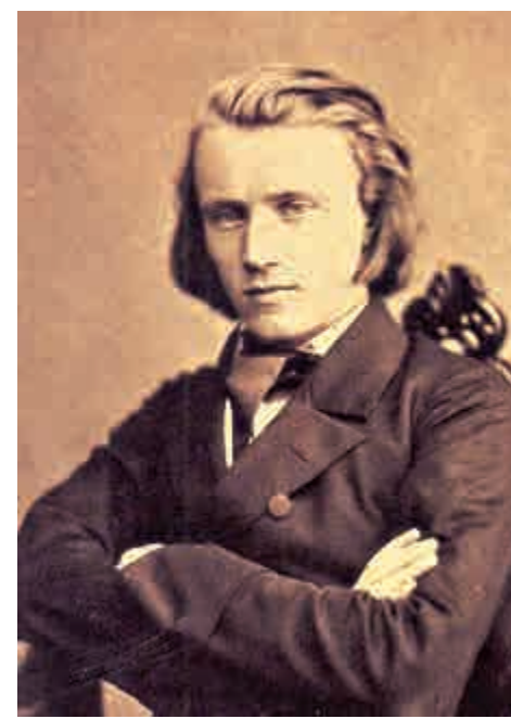
▲一八五三年的布拉姆斯

順帶一提，關於這首奏鳴曲以至貝多芬其他鋼琴奏鳴曲的演奏技巧問題，樂迷如果覺得皇家音樂學院親自出版的欽定指南，即Tovey的《Companion to Beethoven's Pianoforte Sonatas》或Cooper的《Beethoven: 35 Piano Sonatas》過於死板，可以參閱著名學者 Charles Rosen 的《Beethoven's