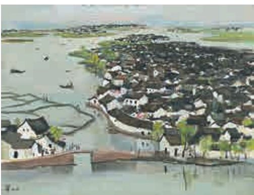
▲吳冠中油畫《魯迅故鄉》，成交價三千九百九十六萬港元（含佣金）

是次拍賣最出人意表的一件拍品當屬中國當代藝術家岳敏君的《天空》（估價六百萬至八百萬港元），以四百萬港元起拍，之後即進入了拉鋸戰，承價次數多達二十次，最終以一千四百四十八萬港元成交（含佣金），高過最高預估價一倍有餘。