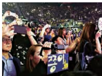
▲「國慶青年音樂會」現場熱情的觀眾

當晚青年音樂會的表演者包括內地歌手吉克雋逸，香港歌手張敬軒、薛凱琪，韓國團體 Infinite、Wonder Girls、Day6，華裔韓國Miss