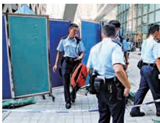
▲死者家人認屍期間傷心痛哭 ▲警員檢走墮斃男生背包調查