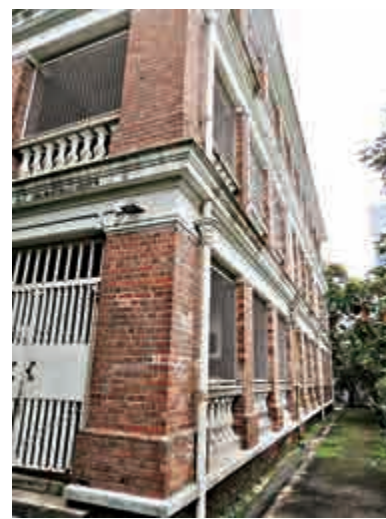
▲已獲評為一級歷史建築、金鐘舊域多利軍營羅拔時樓

羅拔時樓樓高三層，屬愛德華時代古典復興風格，由紅磚砌成的方形立柱，支撐每樓層的古典柱頂和飛簷，加上三層開放式長廊組成的東北立面，展示了這軍事建築的原本風格，立柱之間的護下放置經典的繩狀欄杆柱。整體建築現時仍大致保留原有面貌，屬於一級歷史建築。現所在地的規劃用途為「政府、機構或社區」地帶，規劃意向主要用途包括食肆、教育機構、展覽或會議廳、郊野學習／教育／遊客中心。