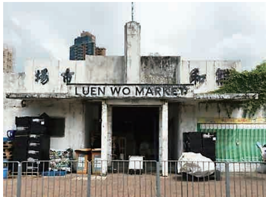
▲有65年歷史的三級歷史建築「聯和市場」