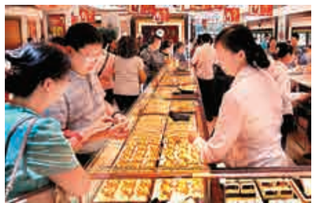
▲5日，上海市民在南京路步行街銀樓選購金飾

【大公報訊】據新華社報道：記者從中國黃金協會獲悉，2015年，中國生產黃金515.88噸，同比增長0.6%，實現工業總