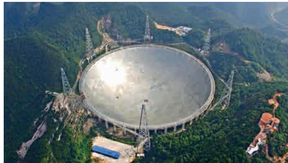
▲位於貴州黔南州平塘縣、被譽為「中國天眼」的500米口徑球面射電望遠鏡於9月25日啓用