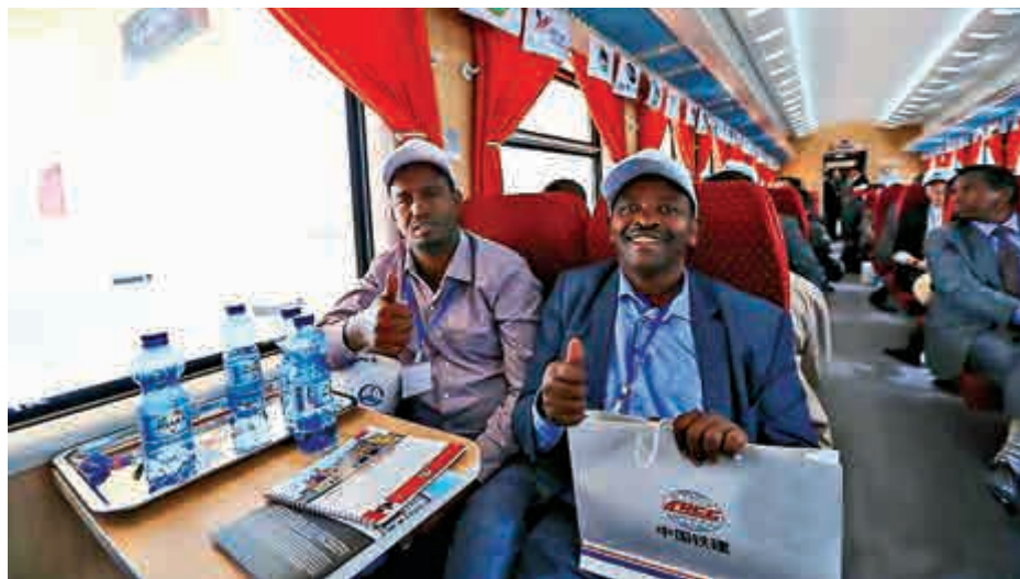
▲乘搭亞吉鐵路首發列車的當地民眾為鐵路豎起了大拇指

《北京日報》5日消息稱，亞吉鐵路連接埃塞俄比亞首都亞的斯亞貝巴、吉布提首都吉布提市，全長752.7公里，全線採用中國二級電氣化鐵路標準施工，設計時速120公里，總投資約40億美元。