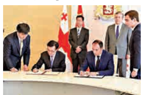
▲5日，在格魯吉亞首都第比利斯，中國與格魯吉亞代表簽署實質性結束自貿協定談判的諒解備忘錄

格魯吉亞打造物流中心和交通中樞的國家發展戰略，同中國倡導的「一帶一路」建設高度契合。目前，中格共建「絲綢之路經濟帶」合作已取得初步進展。