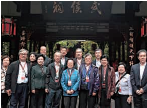
▲成都武侯祠博物館是紀念劉備、諸葛亮等蜀漢英雄人物的廟宇，分為文化遺產區、三國文化體驗傳播區、錦里民俗區三大部分。港區人大代表們在文化遺產區參觀

港區全國人大代表四川視察團昨日並參觀了成都武侯祠博物館和綿竹市孝德鎮年畫村，親身感受四川省豐富的文化旅遊資源，以及對非物質文化遺產的保護工作。