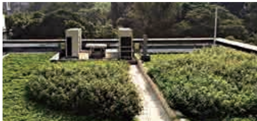
▲建築團隊重新整理原有天台的機電設施，騰出空間進行綠化

機，還原建築物的現代主義建築風格，團隊花了一點小心思，將辦公室窗戶改為雙層窗，窗戶可以開啓，阻隔噪音之餘，亦方便在辦公室內的人打開窗戶引入自然風。至於風機盤管系統中央空調（fan coil unit system）可以分區製冷，令律政司人員即使在加班時段，也有冷氣供應。