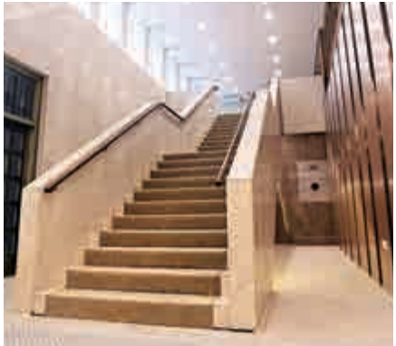
▲昔日行政會議成員接受傳媒採訪的主樓梯(左)，力保面貌不變(右)