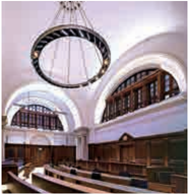
▲上世紀八十年代用作立法會的大樓(左)，活化為百年法庭大廳(右)

中區兩幢地標建築——終審法院大樓、前政府總部陸續完成活化，獲評為法定古蹟的終審法院活化百年法庭大廳，僅靠兩幅照片重現舊貌。年逾半百的前政府總部內的11條樓梯，包括昔日行政會議成員於會議前後接受傳媒採訪、俗稱「扑咪位」所在的主樓梯，如何力保經典面貌不變，同時符合現今建築物條例標準，留住港人集體回憶，活化方案考起建築師。負責今次保育工程的建築署建築師形容，保育歷史建築儼如做「哲學題」，沒有標準答案，克服三大難關要情理兼備。