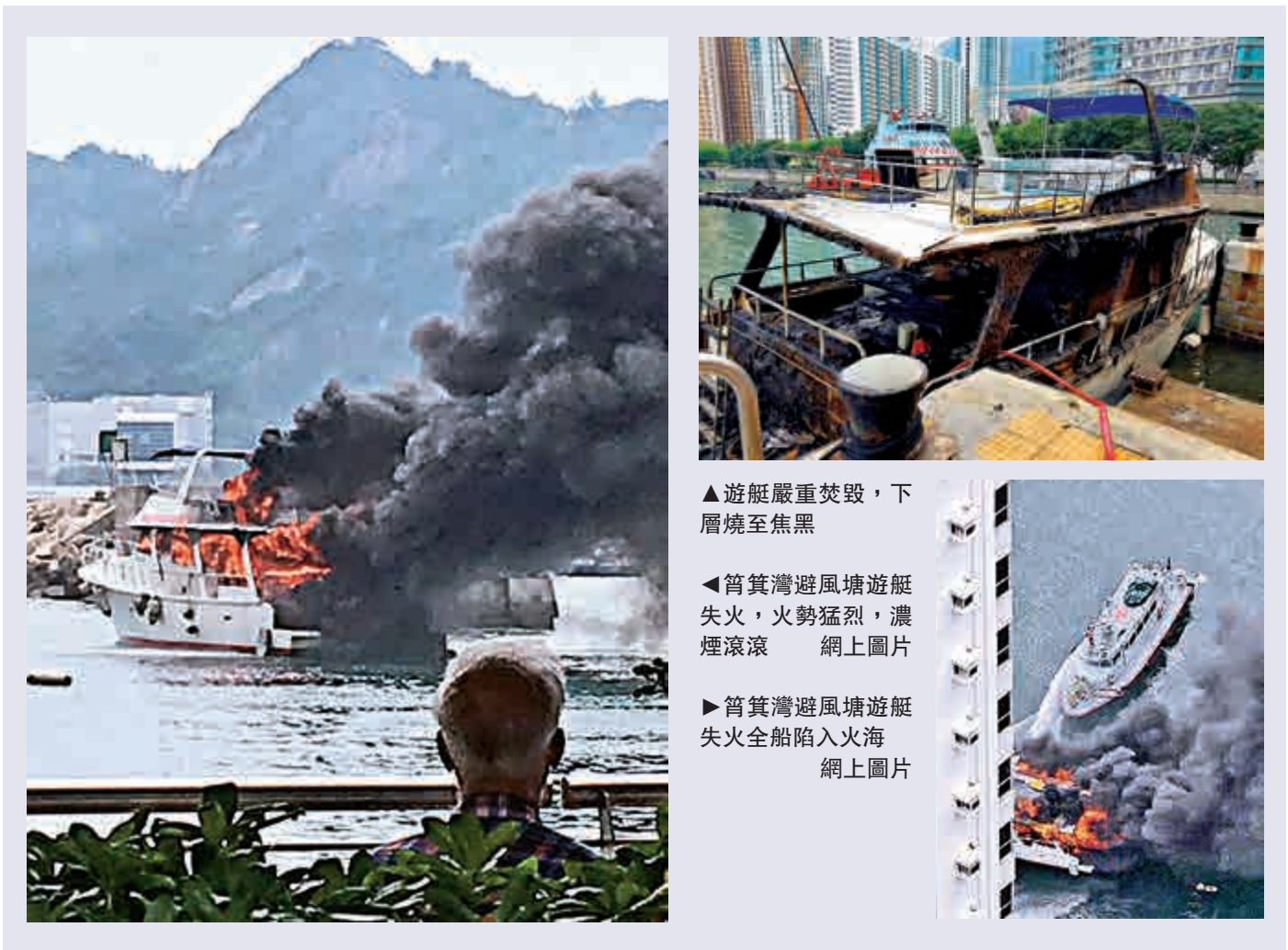
▲遊艇嚴重焚毀，下層燒至焦黑

去年九月二十七日，筲箕灣避風塘曾發生三級火警，一艘蝦艇突然起火，有人斬斷船纜任其漂浮，不料飄向一排住家艇，釀成火燒連環船。