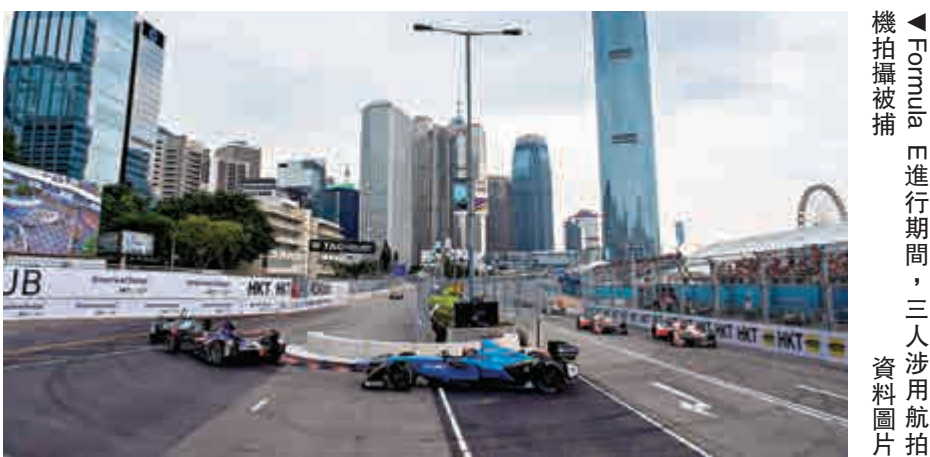
▼Formula E進行期間，三人涉用航拍機拍攝被捕 資料圖片

警方表示，前日（9日）下午四時半，即是Formula E賽事錦標賽進行期間，發現有三部航拍機在中環賽車活動場地上空飛行，嚴重危害公眾安全。警員迅即於龍和道拘捕三名年齡28至42歲男子，他們涉嫌違反《1995年飛航（香港）令》，案件交由中區警區跟進。三人已獲准保釋，須於下月上旬向警方報到。