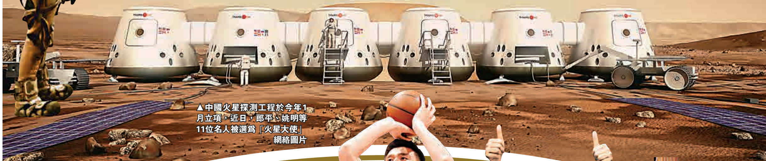
▲中國火星探測工程於今年1月立項，近日，郎平、姚明等11位名人被選為「火星大使」 網絡圖片

近日，郎平、姚明、劉慈欣、「中國三大男高音」等11位名人被選聘為中國火星探測工程形象大使，這也是中國重大科技工程首次啟用形象大使。這11位名人年齡涵蓋老、中、青，專業涉及體育、藝術、文化等多方面，其中三大男高音中的莫華倫更是本港著名歌唱家，在海內外擁有大量擁躉。中國探月與航天工程中心相關負責人表示，「火星大使」們將增進民眾對火星探測工程的理解，更好地展示中國火星探測工程的國家形象。