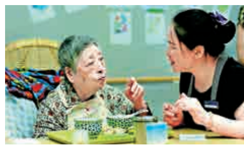
▲上海建長者照護之家，實現居家、社區、機構養老融合