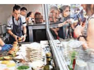
▲上海超八成家庭消費達「小康」。圖為市民在品嚐米其林美食。

費部分）」顯示的結果。但記者發現，在房價、物價等居高不下的上海，「小康」水平對於不少滬家庭來講仍感到有壓力。