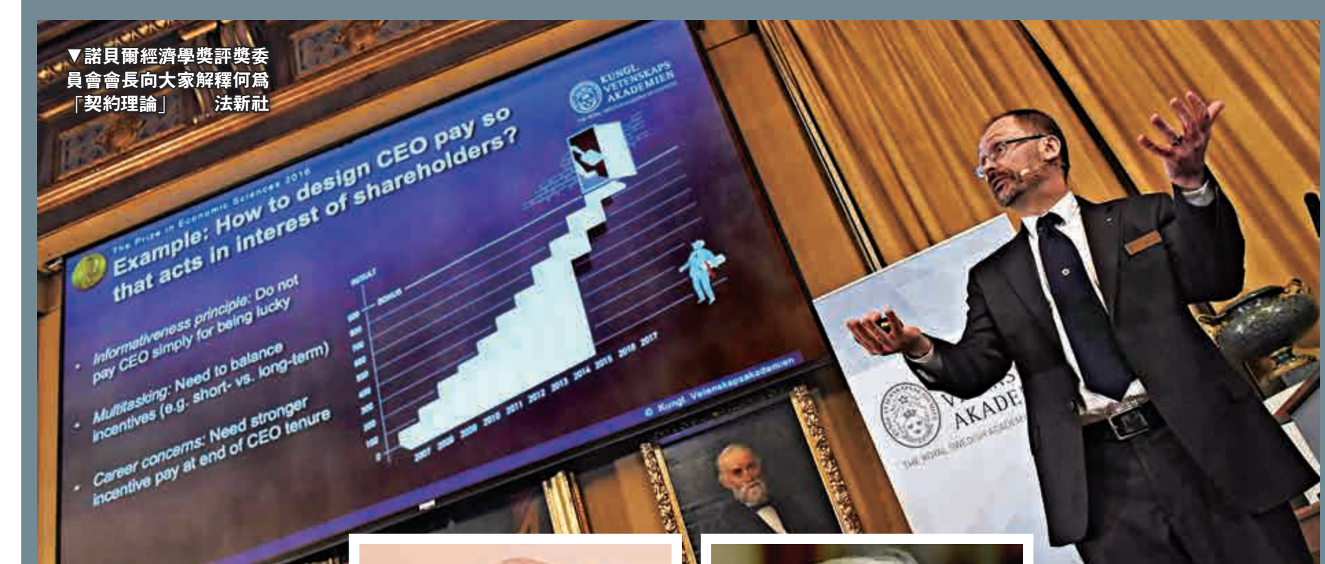
諾貝爾經濟學獎評獎委員會會長向大家解釋何為「契約理論」