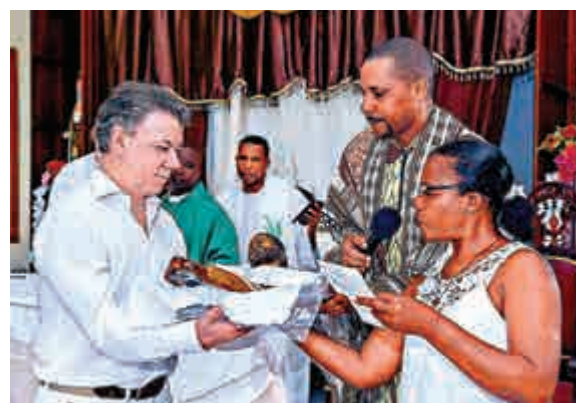
▲和平獎獲獎者桑托斯（左）參加紀念內戰亡者的宗教活動

整，我們就會做調整。」據悉，目前已有超過26萬人流離失所。2002年FARC向一間教堂丟擲炸彈，造成79人罹難，教堂當時收容躲避內戰火火的民衆。