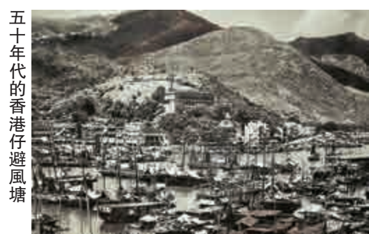
五十年代的香港仔避風塘

四年前李福志逝世，但他在五十年代所拍的影像永存下來。重看舊照，感覺每張都彌足珍貴，驚嘆香港經歷了翻天覆地的變化。從照片中我們亦可找到一些仍然存在的建築物，譬如皇后像廣場的舊最高法院、舊中國銀行大廈與和平紀念碑。一幅由鴨洲洲拍攝香港仔避風塘的照片，亦見到香港仔警署屹立于山腰，如今已活化為蒲窩青少年中心。