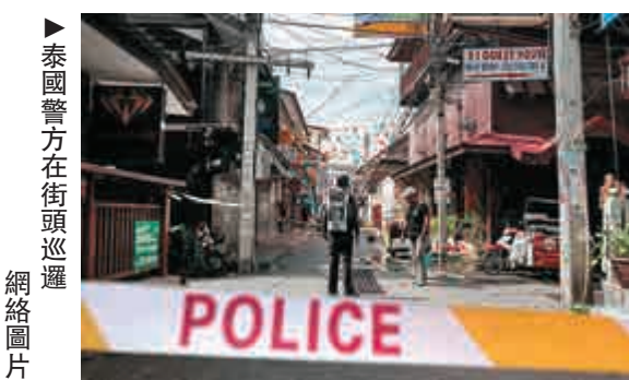
▲泰國警方在街頭巡邏

【大公報訊】據泰國《民族報》報道：泰國警方日前接獲潛在炸彈襲擊威脅，11日宣布已加強首都曼谷主要地標、機場和周邊府的保安。