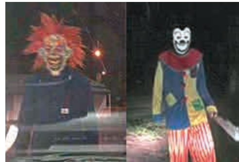
▲歐洲多國近來出現小丑驚嚇路人 英國《每日郵報》

不僅荷蘭出現模仿者，英國各地也傳出有小丑現身。一名懷孕8個月的婦女因為遭到驚嚇而早產，她的友人表示，這名婦女是被一名17歲青少年嚇到早產，所幸母子平安。她呼籲這些嚇人的小丑不要對老年人或孕婦下手，這類無聊的行動應該停止了。英國警方也警告這些模仿者立即停止這種行為。如果被發現他們攜帶武器嚇人，可能會被捕。