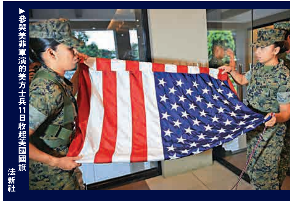
參與美菲軍演的美方士兵11日收起美國國旗

【大公報訊】綜合菲律賓《每日詢問者報》、路透社報道：在即將對中國進行國事訪問前，菲律賓總統杜特爾特10日表示，此次訪華，他將暫時擱置黃岩島主權爭議，只提出漁權議題，並要求中國政府允許菲律賓漁民重返黃岩島海域捕魚。菲律賓軍方表示，與美國舉行的聯合兩棲登陸和實彈演習已經提早一天在11日結束。