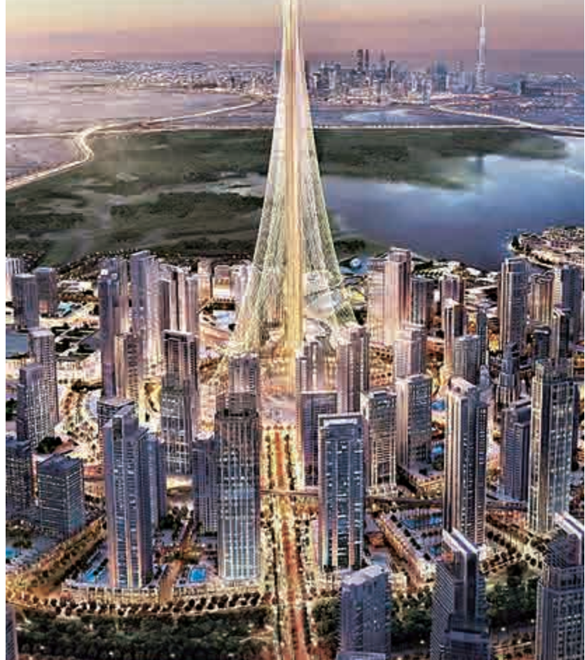
▼迪拜河塔及周邊環境的藝術概念圖

艾馬爾集團至今尚未正式公布該建築最終高度，只表示會比目前全球第一高樓——828米高的迪拜哈利法塔「再高一點」。由於阿聯酋的鄰國沙特阿拉伯正在吉達建造摩天大廈王國塔，設計高度超過1000米，因此迪拜河塔破土動工也標誌着一場「最高」之爭正式拉開序幕。