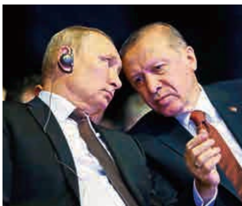
▲土耳其總統埃爾多安和俄羅斯總統普京(左)10日在伊斯坦布爾會面

【大公報訊】據法新社報道：土耳其和俄羅斯兩國領導人10日在伊斯坦布爾簽署天然氣管道建設項目協議。按照合同，「土耳其流」管道項目將從黑海海底通過，經過土