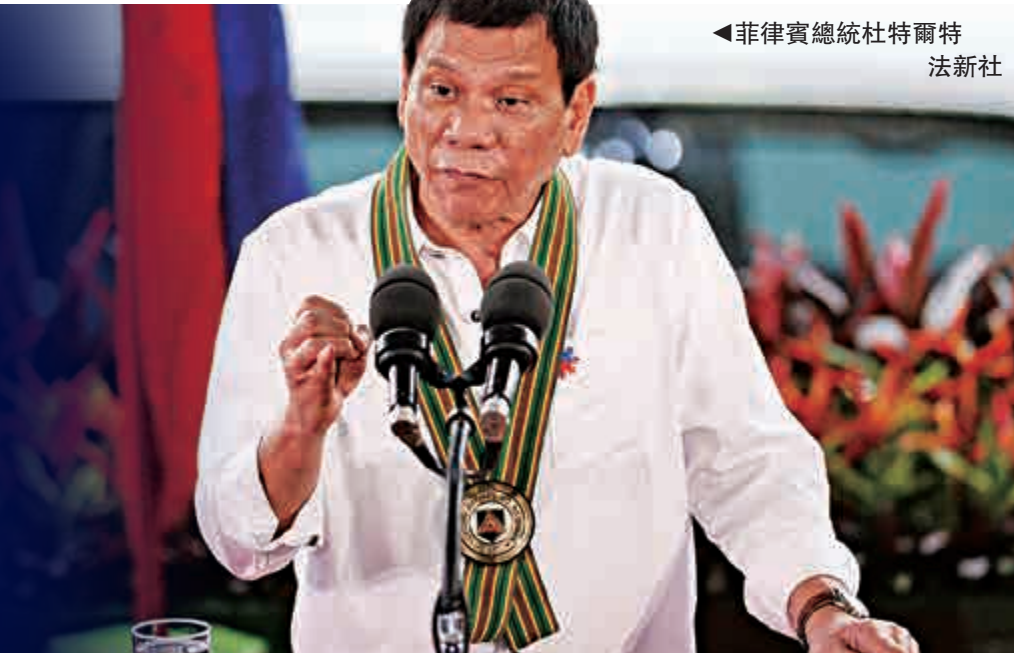
菲律賓總統杜特爾特

【大公報訊】綜合菲律賓《每日詢問者報》、路透社報道：在即將對中國進行國事訪問前，菲律賓總統杜特爾特10日表示，此次訪華，他將暫時擱置黃岩島主權爭議，只提出漁權議題，並要求中國政府允許菲律賓漁民重返黃岩島海域捕魚。菲律賓軍方表示，與美國舉行的聯合兩棲登陸和實彈演習已經提早一天在11日結束。