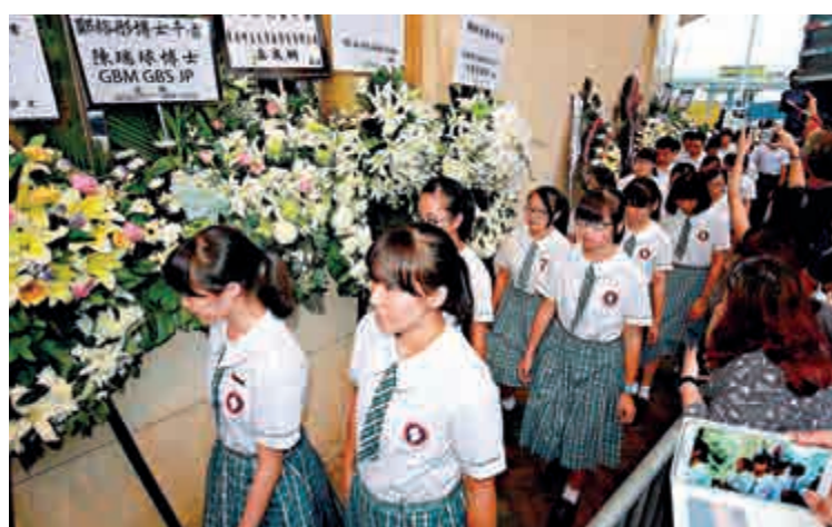
▲順德聯誼總會鄭裕彤中學師生送別彤叔

至於捐助香港高等院校，彤叔不遺餘力先後捐贈香港中文大學教育行政經費3000萬元，及後捐款3500萬元給予香港公開大學擴建校舍，以及捐款四億元予香港大學，支持校園的發展計劃和法律學院的教研發展工作。