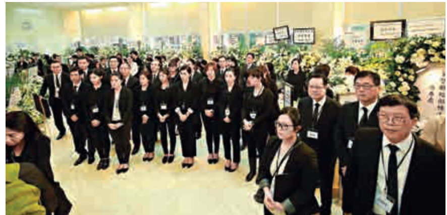
▲彤叔成立新世界發展，奠定主要地產商地位

鄭裕彤在1993年獲邀出任港事顧問，1995年獲委任為全國人民代表大會香港特別行政區籌備委員會委員，回歸前獲委任為香港特別行政區第一屆政府推選委員會委員。為表揚他對社會及公益事務的傑出貢獻，香港特區政府在2008年，向他頒發最高榮譽的大紫荊勳章。