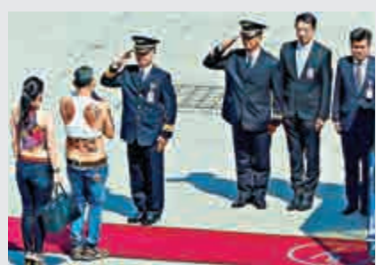
▲今年6月，哇集拉隆功被拍到現身德國機場 網上圖片

2016年7月，英國記者馬歇爾上載了一張哇集拉隆功在德國慕尼黑機場身穿白色背心，露出肚皮，背及手部露出紋身貼紙的照片，當地警方便逮捕了記者，反映軍方有意維護王儲的聲譽。