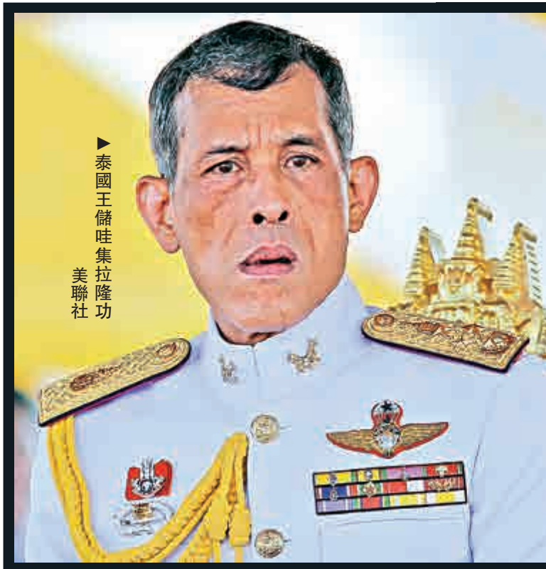
泰國王儲哇集拉隆功