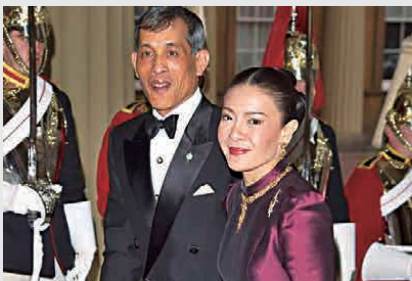
▲王儲哇集拉隆功與第三任妻子西拉米 資料圖片