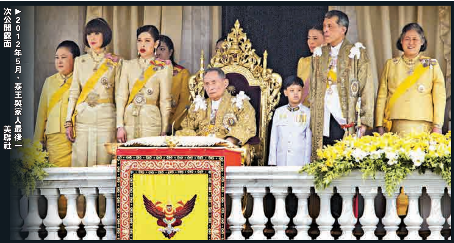
2012年5月，泰王與家人最後一次公開露面