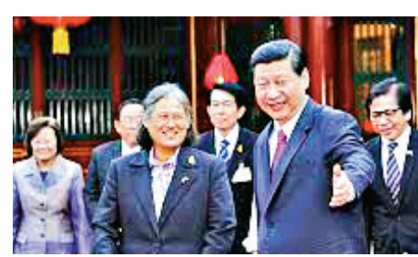
▲2012年4月5日，時任中國國家副主席的習近平會見來訪的泰國公主詩琳通

國，成為泰國王室成員訪華第一人，之後曾多次訪華。公主對中國歷史、文化的熱愛，促使她積極從事中泰兩國友好事業。