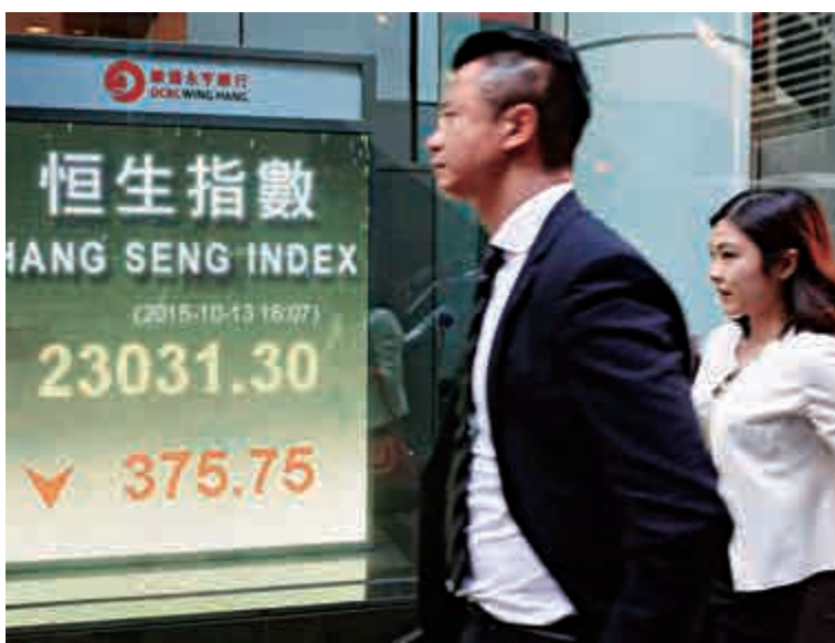
▲港股顯著回吐375點，跌至二萬三關口邊緣

分析指出，外圍沒有重大消息，今輪環球股市跌浪並無支持因素，純屬資金操作行為，很難估底，暫時判斷未必會有較深調整。恒指8月下旬在22700點建立支持位，若再失守，下一個支持位要低至21700點。