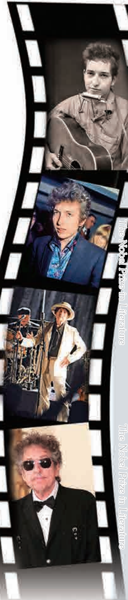
The Nobel Prize in Literature