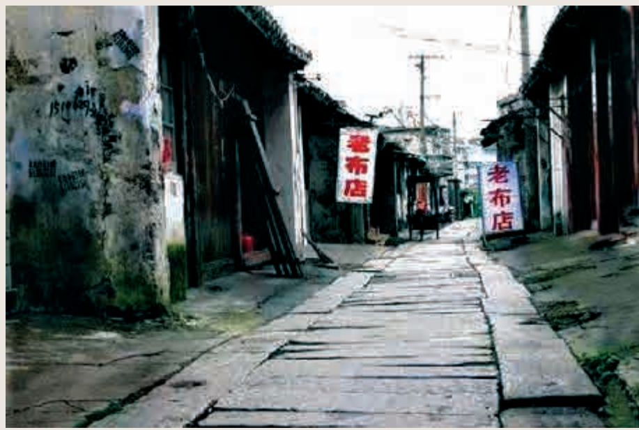
枞茶古鎮內的石板街道