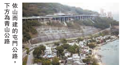
依山而建的屯門公路，下方為青山公路。

新市鎮最初概念是讓居民自給自足，但屯門的就業機會無法滿足區內居民，加上工作模式轉變和工廠北移，許多居民要坐長途車到區外上班，令青山公路和屯門公路的交通不勝負荷。其後經過重建工程和增加交通幹線，情況才有改善。