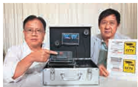
推動的士發展聯會展示自行研發車內攝錄機，紅色圓形封條防止司機自行取出記憶卡。

此外，聯會亦將會與的士司機從業員總會(的總)合作設立投訴熱線。的總代表稱，協會超過30000會員，聯絡到大部分的士司機，將成立「壞司機、好司機龍虎榜」，司機一季內被投訴兩次，的總要求車主取消租約，表現良好的司機可獲得獎金，或由投資者、石油氣商、車主贊助的獎品，作為提供服務的鼓勵。