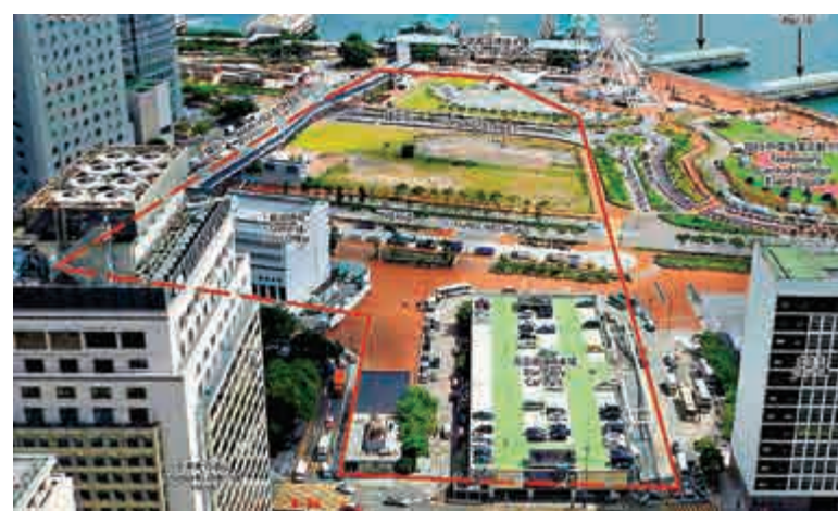
中環新海濱三號用地將分期發展。

但今次規劃署建議，新郵局將遷於「3A用地」其中一幢新建大廈，面向龍和道北面，佔用三層，一層位於地面，另外兩層相連在地庫一樓及二樓，提供設施包括櫃檯、郵政信箱、派遞辦公室、特快專遞。而現時連接中環碼頭至郵政總局的天橋