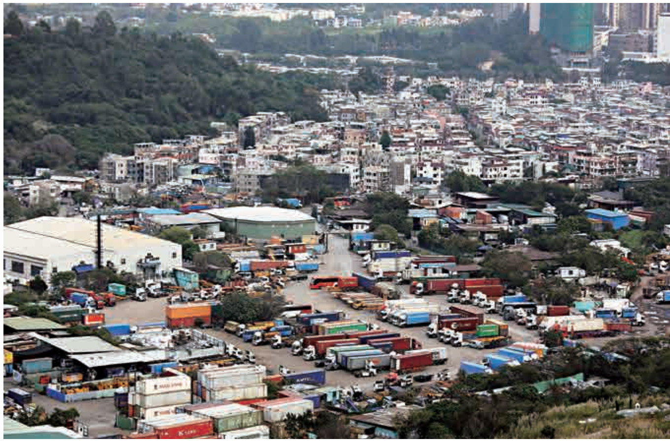
元朗橫洲發展引起社會關注，政府公開研究報告，釋除公眾疑團。資料圖片

消息人士續指，政府在2014年成立跨局跨部門的棕地作業專責小組，現已展開顧問研究，預計可於2018年中完成本港棕地檢討報告，制定棕地處理政策，而規劃署亦將於明年展開新界棕地分布調查，有助進一步了解棕地作業的情況。房署最快明年申請撥款進行橫洲第二、三期的可行性研究，預期需時兩年，當局會配合棕地研究報告，盡快落實發展時間表。