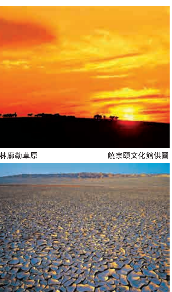
▲錫林庫勒草原

展期至本月三十一日，饒宗頤文化館F座上層展覽廳每天上午十時開放至下午六時，詳情瀏覽：http://www.jtia.hk/nwcc2016-exh-intro。