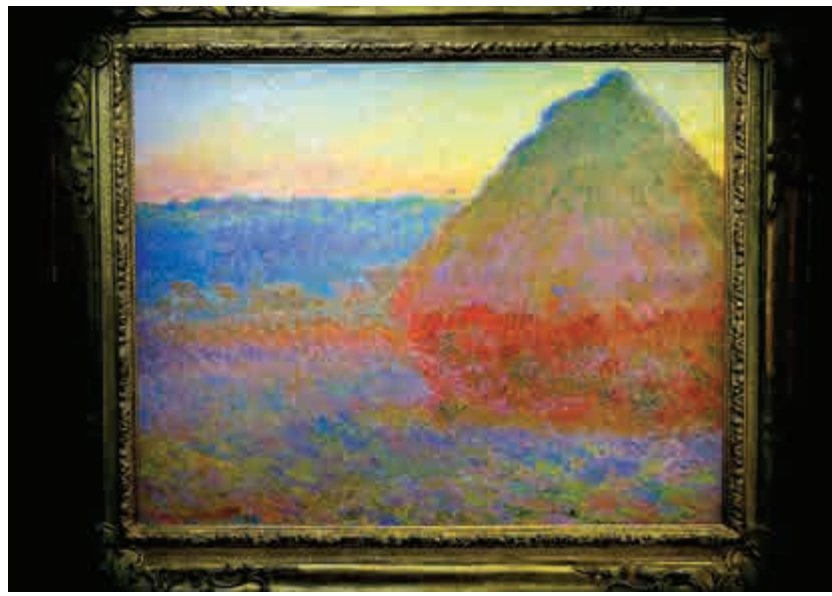
十一月十六日佳士得紐約「印象派及現代藝術」晚拍領拍之作：莫內《乾草堆》(Meule, 1891)