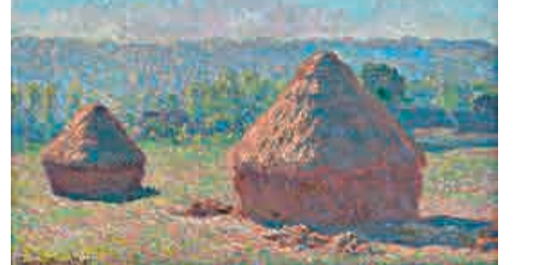
莫內一八九一年繪《乾草堆》系列之《Meules, fin de l'été》，現藏於法國奧賽博物館