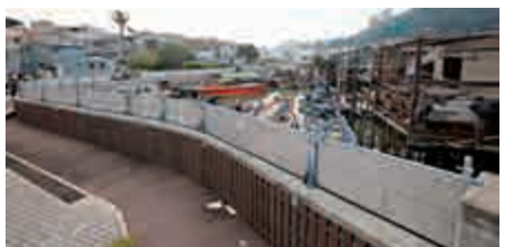
▲渠務署派員到大澳，在防洪堤加裝可拆卸式防洪屏障

麥嘉為稱，防洪堤加裝防洪板後，可應付海圖基準面3.8米以下的潮水。過去50年來，本港從未錄過潮水高度超過海圖基準面3.8米，2008年超強颱風黑格比吹襲香港，水位也只達3.67米，故自兩年前堤落成後，已沒有收過大澳嚴重水浸的報告。他提醒，海馬帶來狂風暴雨，一些處於低窪地區如鯉魚門、西貢等的居民，須時刻保持警覺。