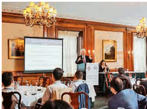
▲美國中國總商會21日特邀專家就CFIUS審查答疑解惑

整。 Brewster表示，中企投資受到CFIUS審查案例的增多，客觀上反映了中國對美投資的顯著增長。但CFIUS並不針對中國，亦不是外界所認為的「純粹基於政治考量」。 今年9月，美國16位國會議員聯名發表公開信稱，需要對CFIUS進行升級，隨後，美國國會政府責任辦公室表示將在四個月內啟動對CFIUS職權和功能的調查，而後給出是否加大對其投入的建議。對此，Brewster建議中國企業密切關注，但不必過於緊張，並表示從政策研究到立法，有諸多因素可能影響CFIUS審查的未來走向。