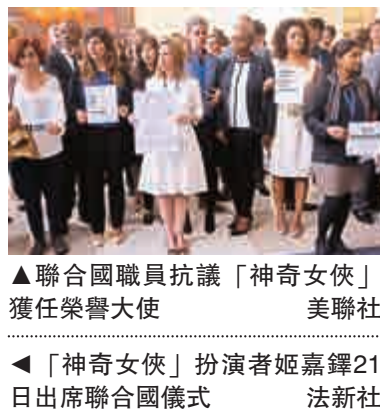
▲聯合國職員抗議「神奇女俠」獲任榮譽大使 ◀「神奇女俠」扮演者姬嘉鐸21日出席聯合國儀式