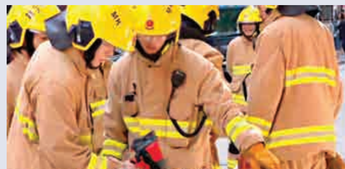
▲消防員利用紅外線測溫儀探測地底 電視截圖