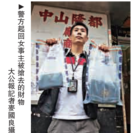
▶警方起回女事主被搶去的財物

返回深水埗寓所時疑不勝酒力，坐在樓梯稍息，其間被一名印度賊人乘機搶去其手袋，內有值6500元名牌銀包及現金，女事主負傷追賊，賊人走後失去去蹤跡，警員到場識破「扮街坊」離開大廈的疑人，人賊並獲帶署扣查。