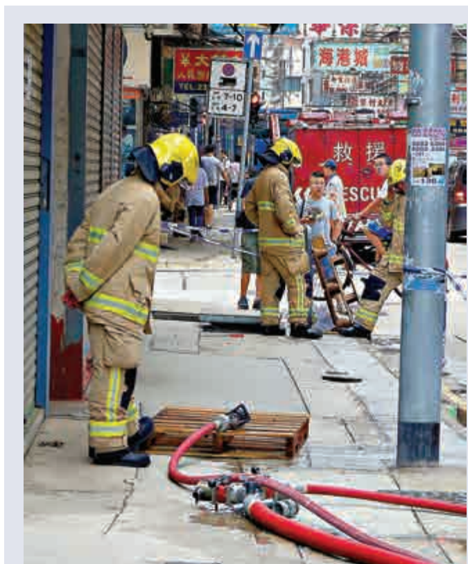
▲廣東道行人路疑地底電纜漏電，出現地熱現象

對於地面離奇出現高溫，有專家指出，很可能是地底高壓電纜出問題，例如電纜絕緣體老化或掘路時破損，另或受雨水滲入電纜等，均可引發不尋常高溫，若溫度持續太高，極可能引發火警甚至爆炸。