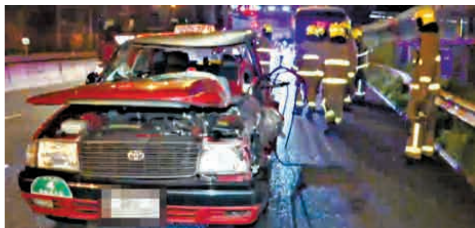
▲大埔公路沙田段的士撞拖車 電視截圖

由於起火單位戶主平日有燃點香燭拜神習慣，一度疑為火警因拜神失火引起，其後經消防員調查後，相信起火元兇為放置客廳一部電視機短路引起，並無可疑。