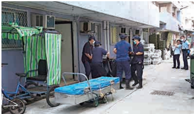
▶長洲東堤小築度假屋揭發雙屍命案

警員在屋內發現兩個炭爐，而窗和門均被膠紙封住，初步相信兩人燒炭輕生，事件無可疑。至於二人尋死原因待查，而在屋內發現兩支紅酒及變壞了的海鮮，不排除二人共晉「最後晚餐」後共赴黃泉。