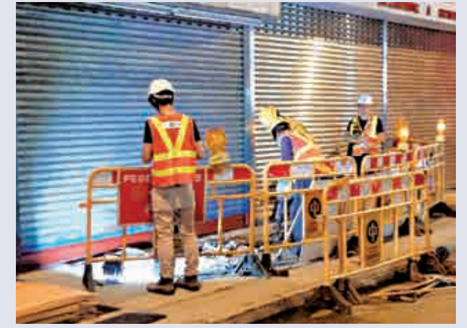
◀中電人員處理電纜 港台圖片