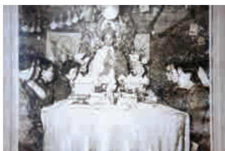
九龍牛池灣鄉的打醮舊照

長洲每年都有打醮，另外適逢今年舉行醮會的鄉村還有幾處。本月初吉澳村剛舉行十年一屆的安龍太平清醮，下月將到沙田田心村、鶴咀半島三村（石澳、大浪灣和鶴咀）和屯門鄉忠義堂，其中鶴咀半島三村是港島現存僅見的太平清醮。