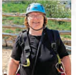
▲女護士在社交網站上的照片

近年，不少國家都發生過殺害長者事件。今年2月，日本神奈川縣一所護老院三名長者先後墮樓身亡，最後被揭發是男看護所為。3月，意大利警方也拘捕了一名55歲的護士，她涉嫌在過往工作期間殺害13名需要重症看護的長者。