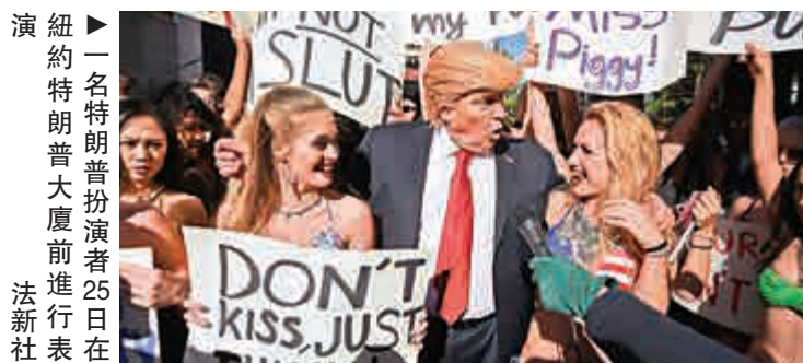
▶一名特朗普扮演者25日在紐約特朗普大廈前進行表演

希拉里競選團隊抨擊他的說法是在「利用美國人的恐懼」，指出兩黨的專家都認為，特朗普不適合擔任三軍總司令。