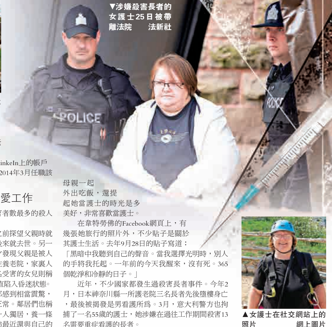
▼涉嫌殺害長者的女護士25日被帶離法院

聽到此消息，韋特勞佛的鄰居都感到相當震驚，指她平時為人謙遜友善，行為都很正常。鄰居們也稱她是一個友善的、低調的住戶，她一人獨居，養一條小狗。另一位鄰居也表示，韋特勞佛最近還與自己的