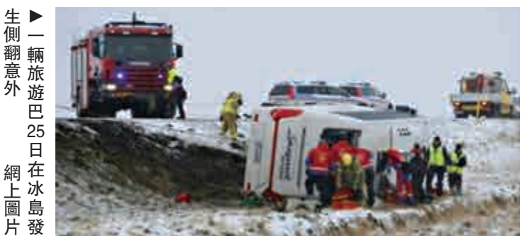
▶一輛旅遊巴士25日在冰島發生側翻意外 網上圖片

中國駐冰島大使館得知消息後高度重視，使館領事官員立即趕赴醫院探望慰問。使館領事官員對記者說，使館將繼續核實了解相關中國遊客的信息，及時提供必要的領保協助。