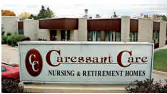
▲涉事的養老院

【大公報訊】綜合法新社、路透社、美聯社報導：加拿大發生駭人聽聞的毒殺長者事件。安大略省一家養老院的一名護士因涉嫌在七年時間裏謀殺八名年邁院友被警方逮捕，25日被控八項一級謀殺。警方表示，這是近10年來該省最惡性的一宗殺人案。