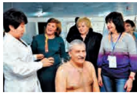
體驗團在黑河市中醫院體驗了按摩、推拿、拔罐等中醫理療項目

內地老年人熱衷通過黑河口岸赴阿州旅居養老，俄羅斯老年人則非常注重養生，熱衷於通過口岸到黑河市以及五大連池風景區火山礦泉康療養生。雙方表示將適時擴大接待能力，積極做好相關工作，為中俄老年人跨國旅居養老提供最優質的服務。