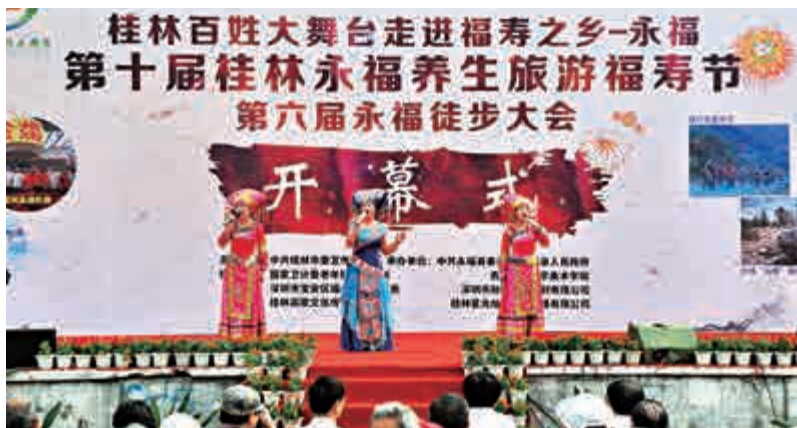
廣西打造10個健康養老小鎮。圖為該省永福縣第十屆福壽節開幕式

預計到2020年，廣西健康養老服務業及相關產業增加值達2000億元人民幣，建成國家養生養老產業基地、國際休閒養生健康養老勝地和全國養老服務業綜合試驗區。