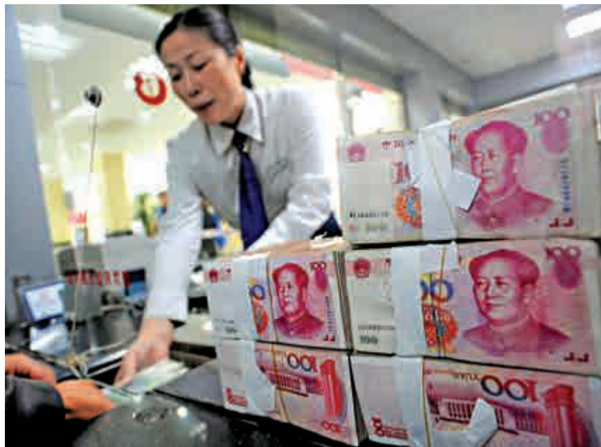
▲有分析表示，人民幣匯價自入籃後加快貶值，投資者勢考慮配置較保值的資產以作避險，加上中國比特幣價格出現溢價，是投資者對沖人民幣貶值的方式，並預料這勢頭或延續至今年底