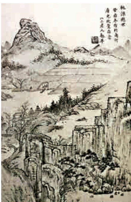
▲冒懷科母親賀翹華的畫作，曾在日本、巴黎、莫斯科等地展出 書中圖片

「十年窗下無人問，一舉成名天下知」，努力讀書考取功名，光宗耀祖似乎是舊時代世家的普遍現象，一代又一代的人讀書，幾代人下來便形成了自家的學問「家學」，不僅有功名，而且還有實學，進可以為官，退可以講學，這是文化世家另一個特色。螺洲陳家陳寶琛成為宣統皇帝溥儀的老師，其學問當然不是泛泛之輩可