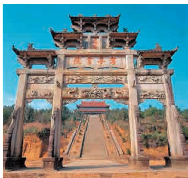
▲朱家先祖宋代大儒朱熹曾講學的福建考亭書院