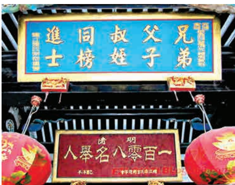
▲螺洲陳家的功名牌匾 網絡圖片