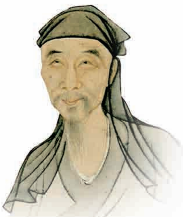
▲明末四公子之一冒辟疆