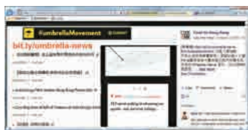
▲Code4HK製作的手機軟件包括「佔中抗爭地圖」