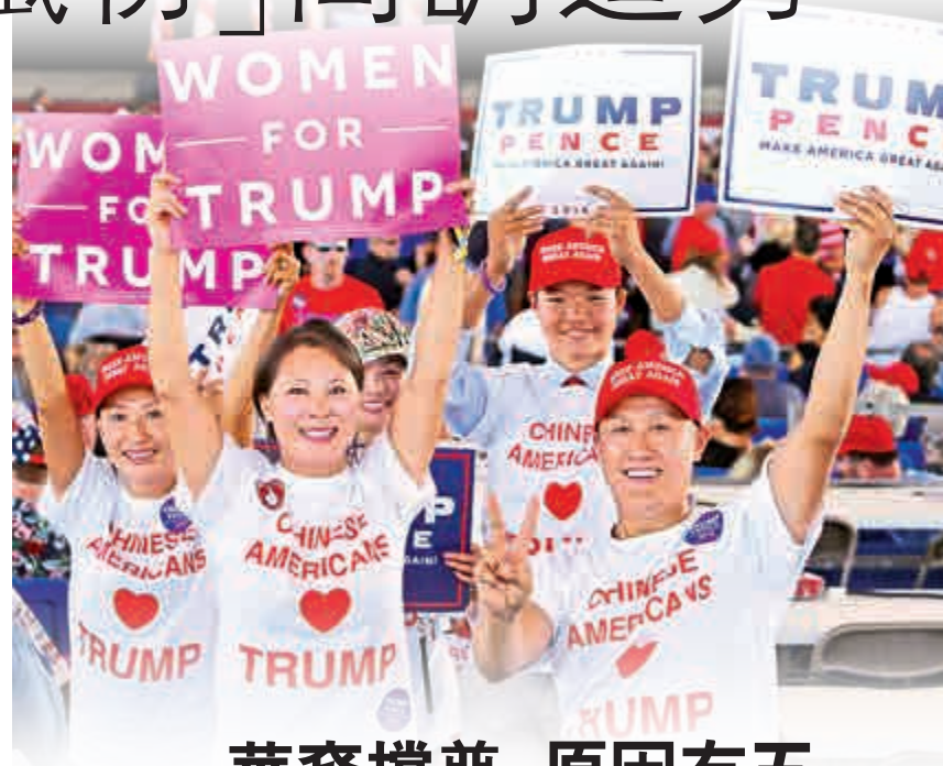
▲華裔支持者10月在佛州為特朗普造勢