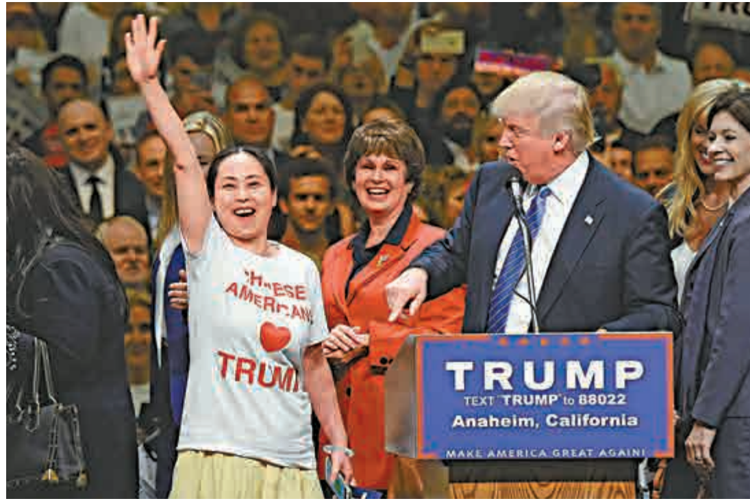
▲5月在加州，華裔支持者與特朗普(右)同台