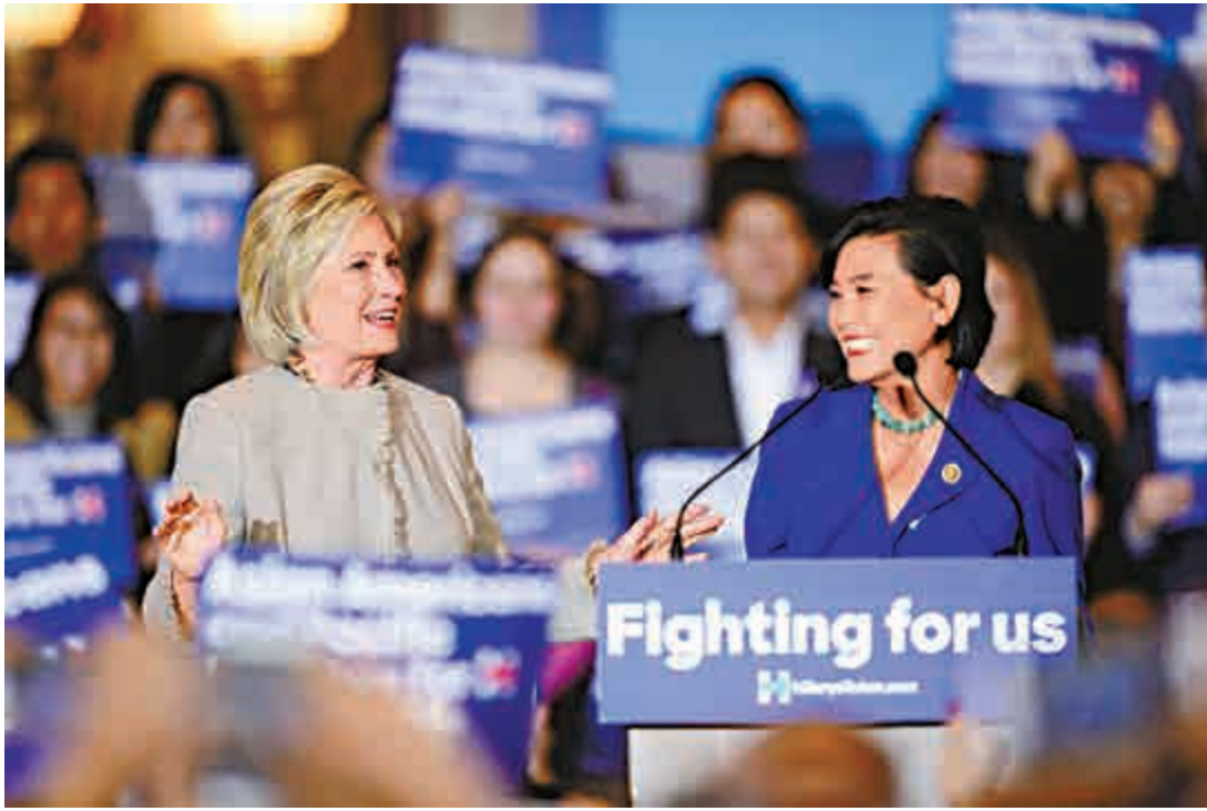
▲民主黨聯邦眾議員趙美心(右)為希拉里站台