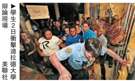
▲學生2日衝擊迪拉德大學辯論現場

杜克說：「我不是反對所有猶太人，但這強大的族群主導了美國的傳媒和國際銀行，這很有問題。」又稱自己是「特朗普擁護者」。民主黨人費爾特則形容他為「壞蛋」和一條「從沼澤鑽出來的蛇」。當天約60到70名極度憤怒的示威者，有的不滿白人至上主義者杜克出席，有的不滿主辦方不讓學生進入辯論現場，他們衝擊辯論會大樓的入口，校園警察兩度出動胡椒噴霧驅散他們，至少一人被警方拘留，事後獲釋，無人嚴重受傷。