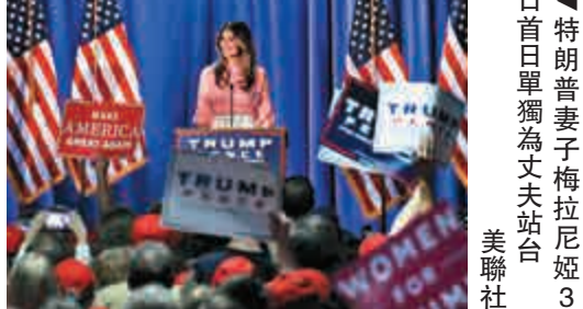
▲特朗普妻子梅拉尼婭3日首日單獨為丈夫站台