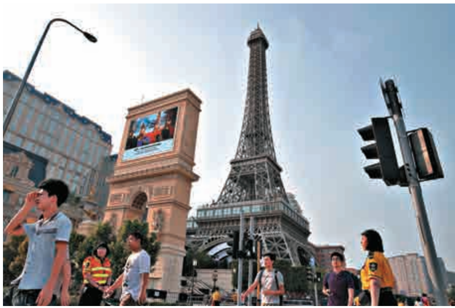
▲今年九月開幕的澳門巴黎人表現標青，帶動金沙中國截至今年九月底止第三季經調整物業EBITDA同比升逾15.3%