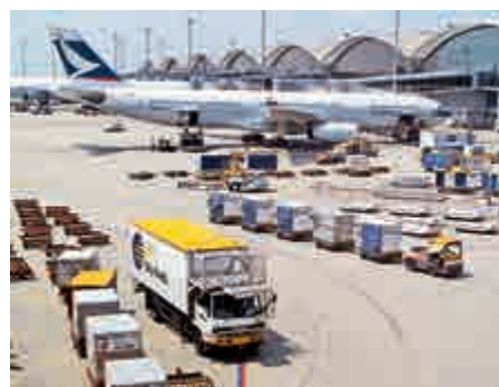
▲全球航空貨運業仍面臨眾多挑戰