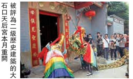
被評為二級歷史建築的大石口天后宮本月重開

是次重修，華人廟宇委員會資助五百四十多萬元，加上長洲鄉事委員會和善信籌得八十多萬元，令廟宇煥然一新。開幕當日，各方團體到來舞獅和舞麒麟，麒麟入廟講究規矩，不能走中門，要由左邊進入，而且必須半走走跑，不能高過神桌。參拜動作是打八字，之後面向神靈離開，直至走出門口才可掉頭。 在長洲的節慶中，一定會遇見一種頭大面闊、擁有巨型彎角的瑞獸，此乃海陸豐的麒麟，由一支掛上「神」字的燈幡引領前進。舞者在獨特的音樂節奏下大幅度地不停轉動，使旁人看到十分投入。