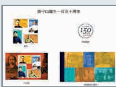
▲香港郵政聽日會推出孫中山紀念郵票

聽日11月12日係國父孫中山誕生150周年，為紀念呢位偉大嘅愛國主義者同中國革命先驅，香港郵政聽日推出一套四枚嘅紀念郵票，而內地、香港同澳門三地郵政，當日仲會罕有咁共同發行一款紀念套摺。