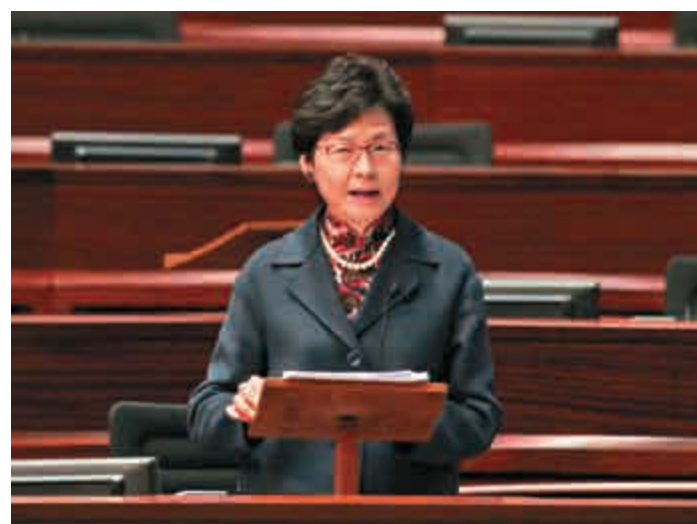
▲林鄭月娥稱，終止李寶蘭署任純粹是人事管理決定

林鄭：終止署任無受干預 政務司司長林鄭月娥總結發言時稱，白韜六履行廉政專員權責，終止李寶蘭署任，純粹是人事管理決定，完全是按照現行政府和廉署規條和指引進行，並無受任何人干預。她又引述白韜六指，硬將這事件與行政長官和UGL簽訂離職協議扯上關係，毫無事實根據，利用此事讓立法會介入和干預廉署內部人事管理事宜，將嚴重打擊廉署獨立運作。