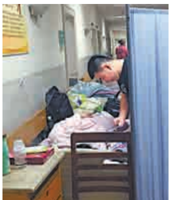
▲廣州某知名三甲醫院，產科病房病床不夠，只好在走廊加床

此外，督察組認爲，內蒙古還存在水和空氣污染防治工作推進滯後；部分歷史遺留及群眾關心問題亟待解決兩方面問題。（記者 馬靜）