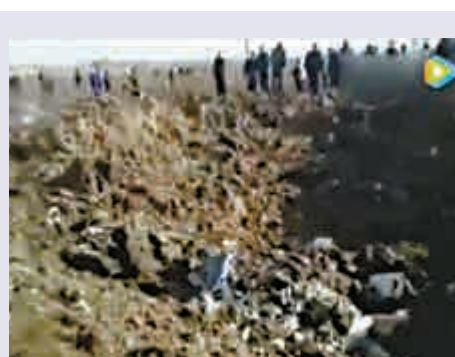
▲疑似墜機造成的大坑