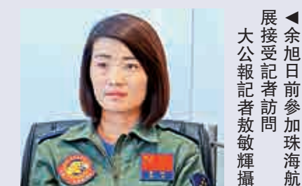
▲余旭日前參加珠海航展接受記者訪問

2009年10月1日，余旭參加中華人民共和國國慶60周年閱兵，擔任教-8梯隊三隊右二僚機。2012年7月29日，她駕駛中國自主研发的三代戰機首次單飛。余旭不僅是中國首批殲擊機女飛行員，也是中國第一位殲10戰鬥機女飛行員。在參加2015年紀念抗日戰爭勝利70周年閱兵時，余旭作為地面備份人員，為左-3位置3號機備份。「金孔雀」是人們對余旭的愛稱。