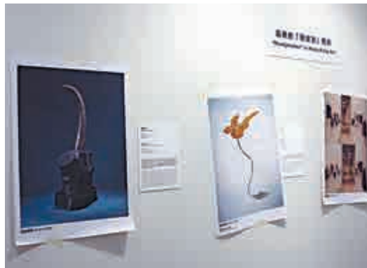
▲以日常生活物品為元素的香港「現成物」藝術代表作品