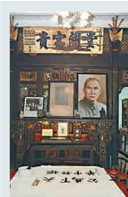
▲►馬英九在馬來西亞進行第2天訪問行程，走訪檳城的孫中山先生事跡處所。圖為他在孫中山檳城基地紀念館揮毫寫下「天下為公，振興中華」

蔡英文委任宋楚瑜為特使出席APEC可謂「司馬昭之心，路人皆知」，無非就是利用宋楚瑜過去與大陸的良好關係