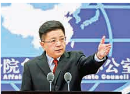
▲馬曉光希望美國新政府恪守一個中國政策和中美三個聯合公報原則

【大公報訊】據中新社北京報道：國務院台辦發言人馬曉光16日在北京指出，台灣問題是中美關係中最重要、最敏感的問題，希望美國新政府恪守一個中國政策和中美三個聯合公報原則，妥善處理涉台問題。