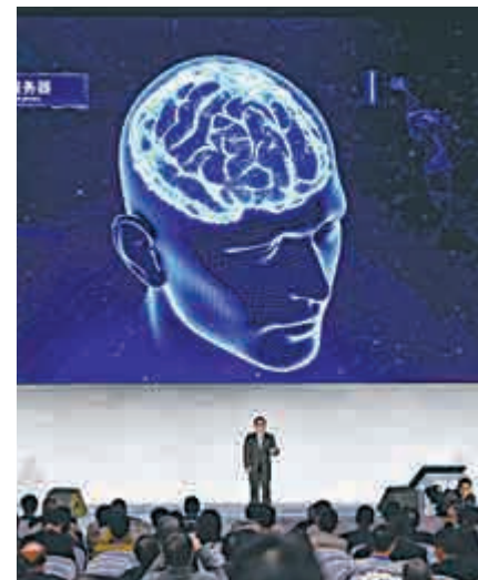
▲北京百度網訊公司代表在介紹「百度大腦」人工智能技術