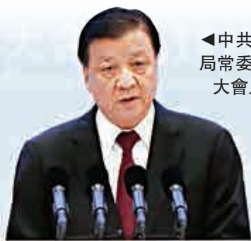
▲中共中央政治局常委劉雲山於大會上致辭