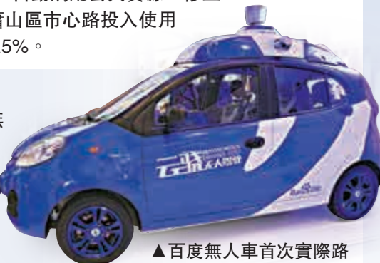
▲百度無人車首次實際路測試備受注目

世界互聯網大會期間，百度無人車於國內首次在全開放城市道路複雜路況下，實現全程無人人工干預自動駕駛技術，最快能以每小時60公里速度行駛，緊急情況下反應時間僅需0.1到0.2秒。