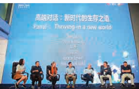
▲深圳國際雙創周期間主題為「眾創先鋒·智贏未來」的龍崗區創新創業人才峰會

自2015年6月成立以來，在龍崗區科技創新局的關心和指導下，中心累計舉辦活動72場，有效服務企業8580家，簽訂合作合同121項，合同金額達8千多萬元。此次，借助高交會的契機，中心聯合深圳大學舉辦專場分享沙龍，為企業創造就業與高校專家進行面對面交流機會，由高校專家教授分享自己的科研成果、研究心得，並與企業進行思想碰撞，為校企之間技術合作、企業技術引進創造機會。